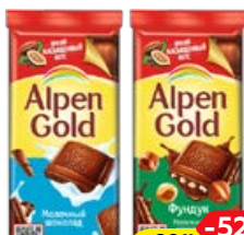
Шоколад ALPEN GOLD, в ассортименте*, 80 г/85 г/90 г