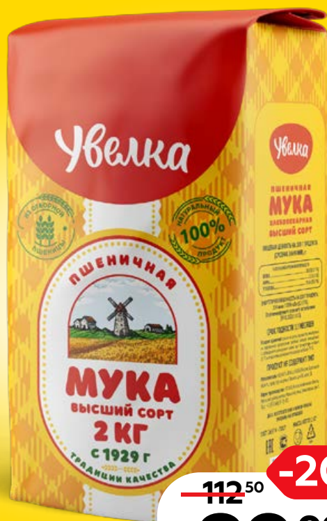
Мука УВЕЛКА, высший сорт, 2 кг