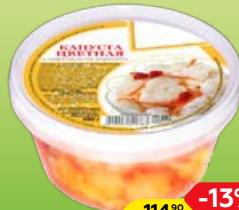
ЦВЕТНАЯ КАПУСТА с морковью по-корейски, 300 г