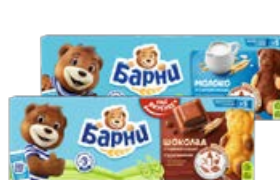
Пирожное МЕДВЕЖОНОК БАРНИ, в ассортименте*, 150 г