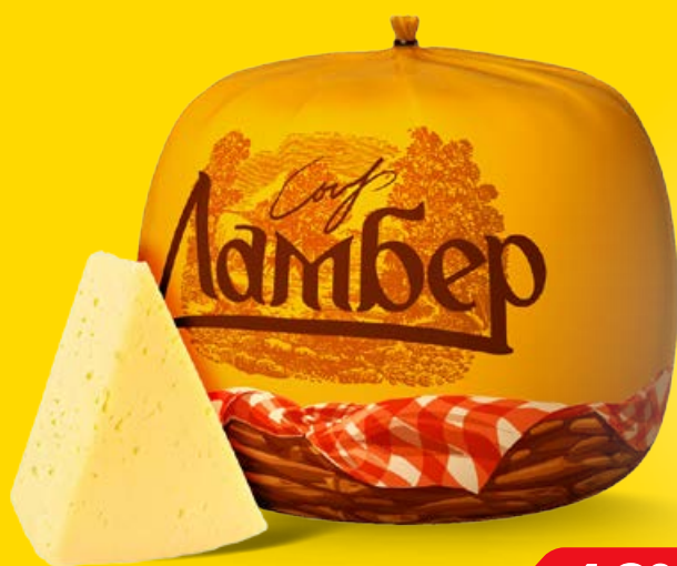
Сыр ЛАМБЕР, 100 г

Рекламная акция «Магнит Семейный» и «Магнит Экстра» 20 - 26 апреля 2022 г.