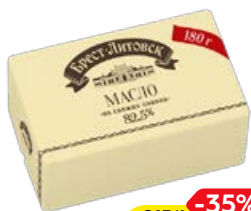
Масло сладко-сливочное БРЕСТ-ЛИТОВСКОЕ, 82,5%, 180 г