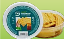
Спаржа МАГНИТ по-корейски, 200 г