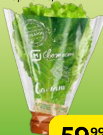
САЛАТ листовой в горшочке, 1 шт.