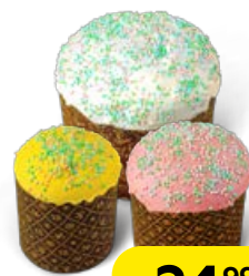
Кулич** ПАСХАЛЬНЫЙ, (СП), 100 г/200 г/450 г