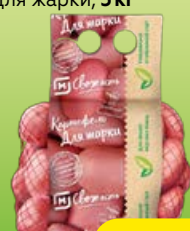
Картофель МАГНИТ СВЕЖЕСТЬ для жарки, 3 кг