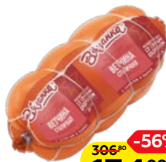
Ветчина ВЯЗАНКА, Столичная (Стародворские колбасы), 500 г