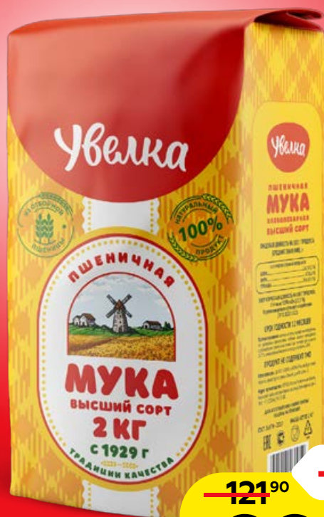
Мука пшеничная УВЕЛКА, высший сорт, 2 кг