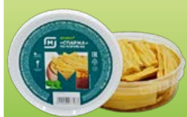
Спаржа МАГНИТ, по-корейски, 200 г