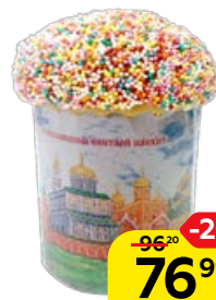
Кулич ПАСХАЛЬНЫЙ, (ООО Хлебная карусель) 150 г