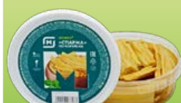
Спаржа МАГНИТ, по-корейски, 200 г