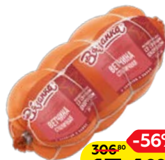
Ветчина ВЯЗАНКА, Столичная (Стародворские колбасы), 500 г