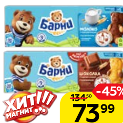
Пирожное МЕДВЕЖОНОК БАРНИ, в ассортименте*, 150 г