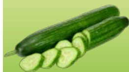
ОГУРЕЦ длинноплодный, 1 шт.