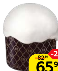
Кекс РОДНЫЕ ПРОСТОРЫ, Творожный с изюмом, 100 г