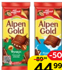
Шоколад ALPEN GOLD, в ассортименте*, 80г/85г/90г