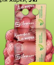
Картофель МАГНИТ СВЕЖЕСТЬ для жарки, 3 кг