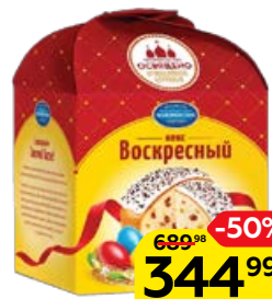
Кекс ВОСКРЕСНЫЙ, особый, 430 г