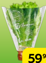
Салат листовой МАГНИТ СВЕЖЕСТЬ, в горшочке, 1 шт.