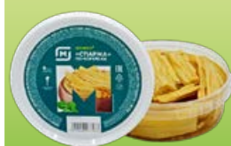
Спаржа МАГНИТ, по-корейски, 200 г