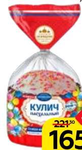
Кулич ПАСХАЛЬНЫЙ (БКК Коломенский), 250 г