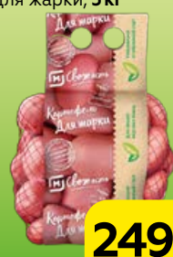
Картофель МАГНИТ СВЕЖЕСТЬ для жарки, 3 кг