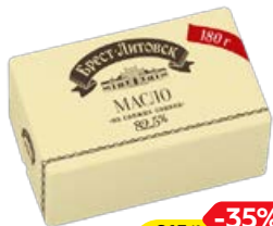
Масло сливочное БРЕСТ-ЛИТОВСК, 82,5%, 180 г