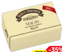
Масло сливочное БРЕСТ-ЛИТОВСК, 82,5%, 180 г