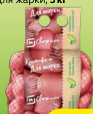
Картофель МАГНИТ СВЕЖЕСТЬ для жарки, 3 кг