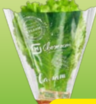
Салат листовой МАГНИТ СВЕЖЕСТЬ, в горшочке, 1 шт.