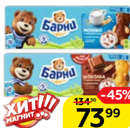
Пирожное МЕДВЕЖОНОК БАРНИ, в ассортименте*, 150 г