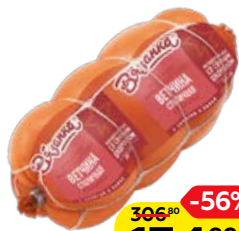
Ветчина ВЯЗАНКА, Столичная (Стародворские колбасы), 500 г