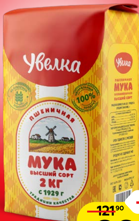
Мука пшеничная УВЕЛКА, высший сорт, 2 кг