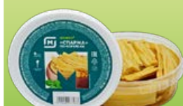
Спаржа МАГНИТ, по-корейски, 200 г