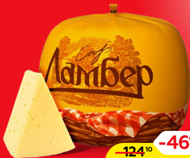
Сыр ЛАМБЕР, 100 г

Рекламная акция магазинов Магнит у дома 20 - 26 апреля 2022 г.