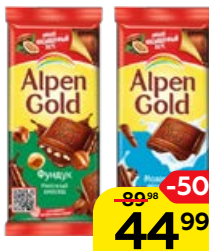
Шоколад ALPEN GOLD, в ассортименте*, 80г/85г/90г