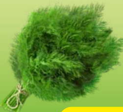
УКРОП, 100 г