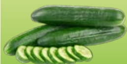
ОГУРЕЦ среднесплодный, 1 шт.