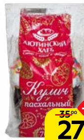
Кулич АЮТИНСКИЙ ХЛЕБ, Пасхальный, 70 г