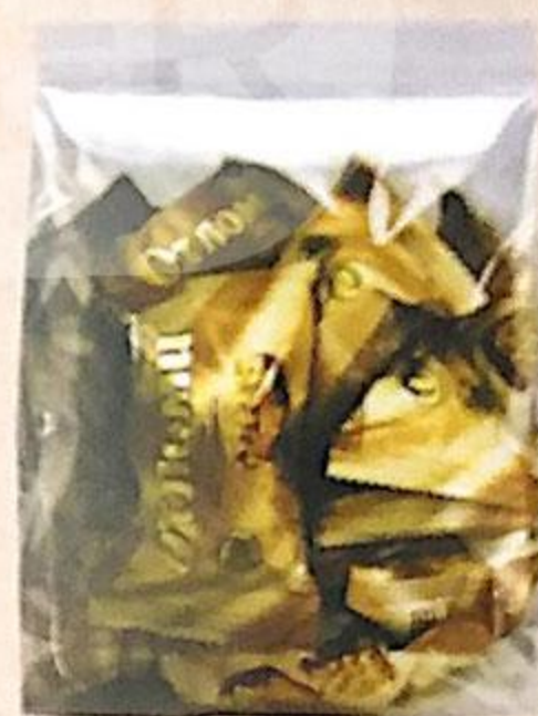
КОНФЕТЫ ОТЛОМИ НЕГЛАЗИРОВАННЫЕ, АККОНД, 500 г