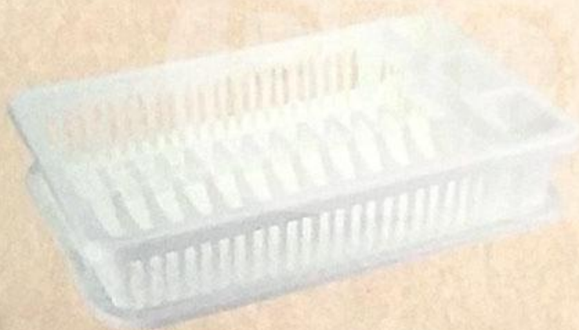
СУШИЛКА ДЛЯ ПОСУДЫ 42X27,5X8,5 CM