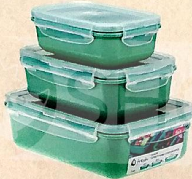
НАБОР ЁМКОСТЕЙ ДЛЯ ПРОДУКТОВ 0,4 Л; 0,8 Л; 1,4 Л, 1 УП.