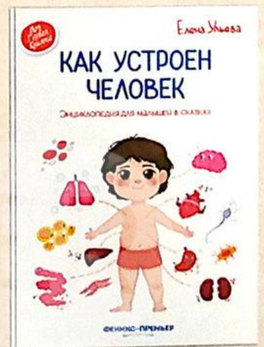
ЭНЦИКЛОПЕДИЯ ДЛЯ МАЛЫШЕЙ 39,5X28,7X24,5 CM