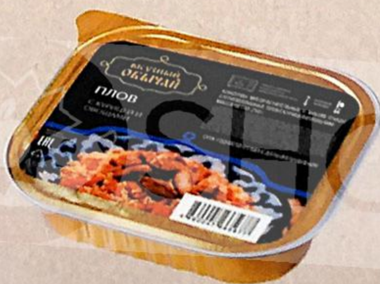
ПЛОВ ВКУСНЫЙ ОБЫЧАЙ В КОНСЕРВАХ, С КУРИЦЕЙ И ОВОЩАМИ, 250 г