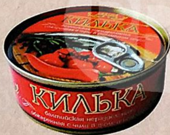
КИЛЬКА БАЛТИЙСКАЯ ОБЖАРЕННАЯ С ЧИЛИ В ТОМАТНОМ СОУСЕ, 240 г