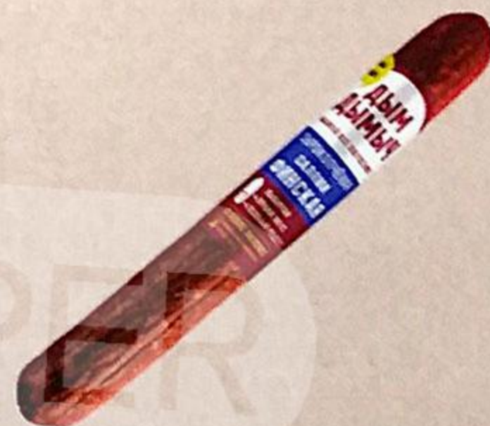
КОЛБАСА САЛЯМИ ФИНСКАЯ СЫРОКОПЧЕНАЯ, ДЫМ ДЫМЫЧЬ, 200 г