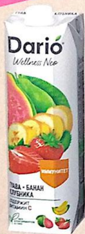
НЕКТАР DARIO ГУАВА-БАНАН-КЛУБНИКА, 1 л