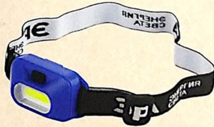
ФОНАРЬ ЭРА НАЛОБНЫЙ, СВЕТОДИОДНЫЙ, GB-707, 1 ШТ.