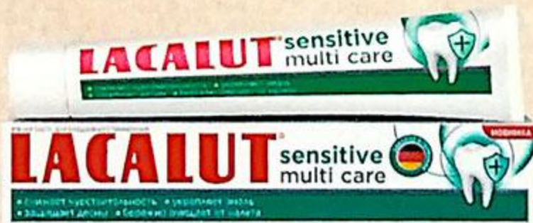
ЗУБНА ПАСТА LACALUT SENSITIVE MULTI CARE, 60 Г