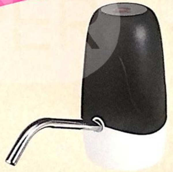
ПОМПА ДЛЯ ВОДЫ ЭЛЕКТРИЧЕСКАЯ, 1 ШТ.