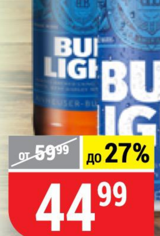
ПИВО BUD light, светлое, 4,1%, 0,44-0,45 л 160031/144906