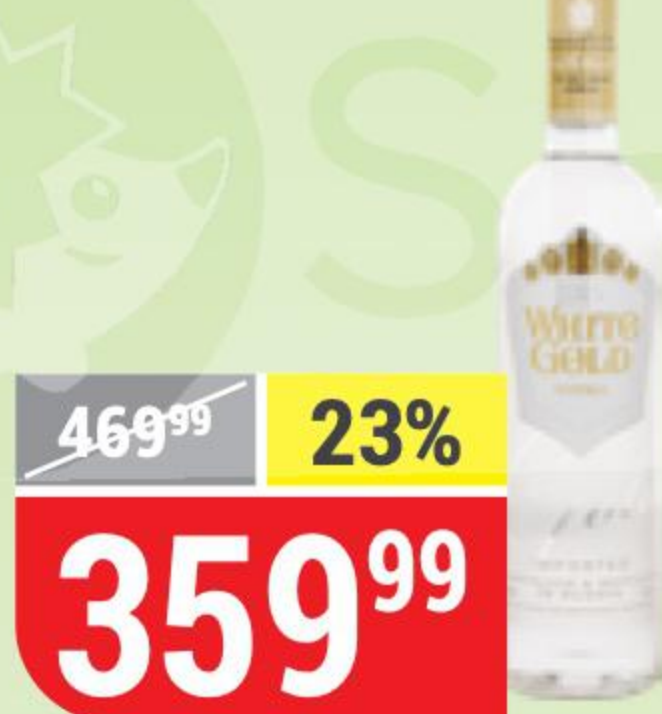
ВОДКА WHITE GOLD premium, 40%, 0,5 л 161903