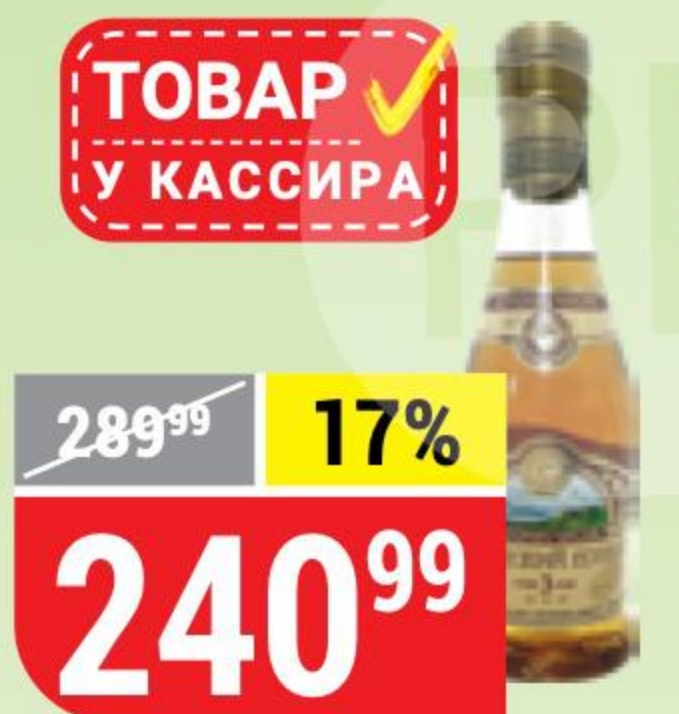
КОНЬЯК АРМЯНСКИЙ 3 года, 40%, 0,25 л 145172