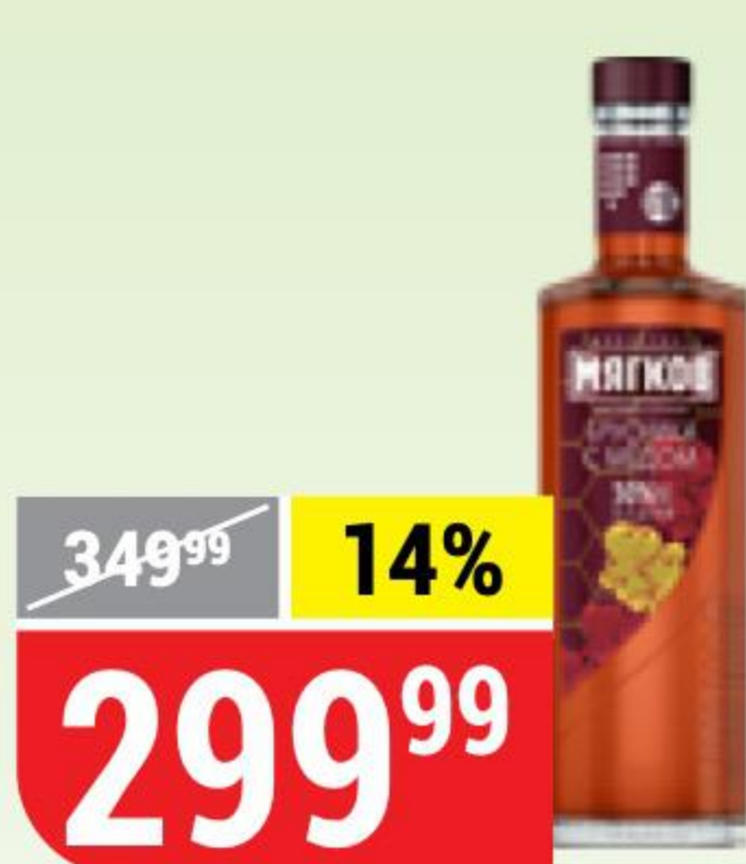
НАСТОЙКА МЯГКОВ брусника-мед, горькая, 30%, 0,5 л 163796