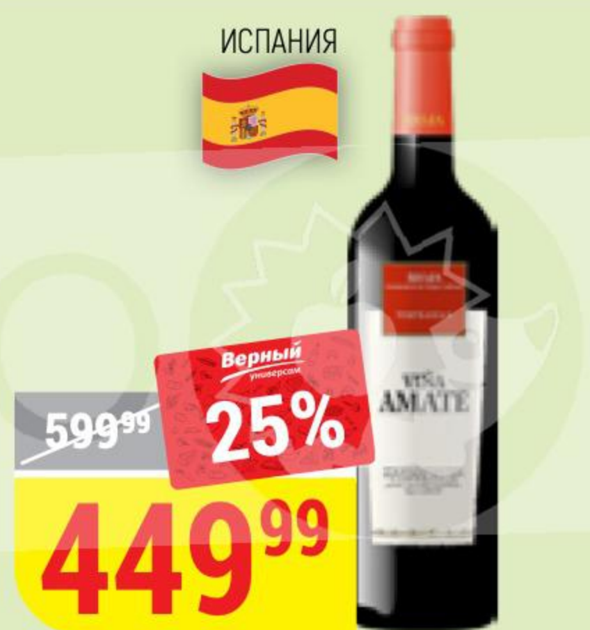
ВИНО VINA AMATE tempranillo rioja, красное, сухое, 14%, 0,75 л 163416