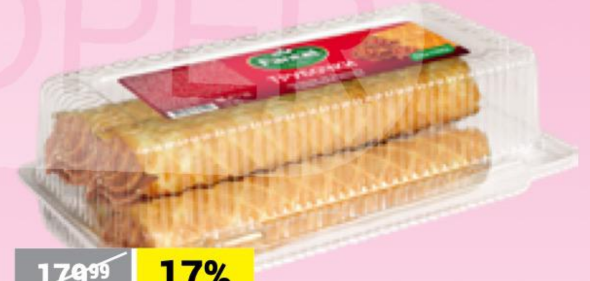
ТОРТ ВАФЕЛЬНЫЙ ШОКОЛАДНИЦА классическая, Коломенское, 240 г 137141