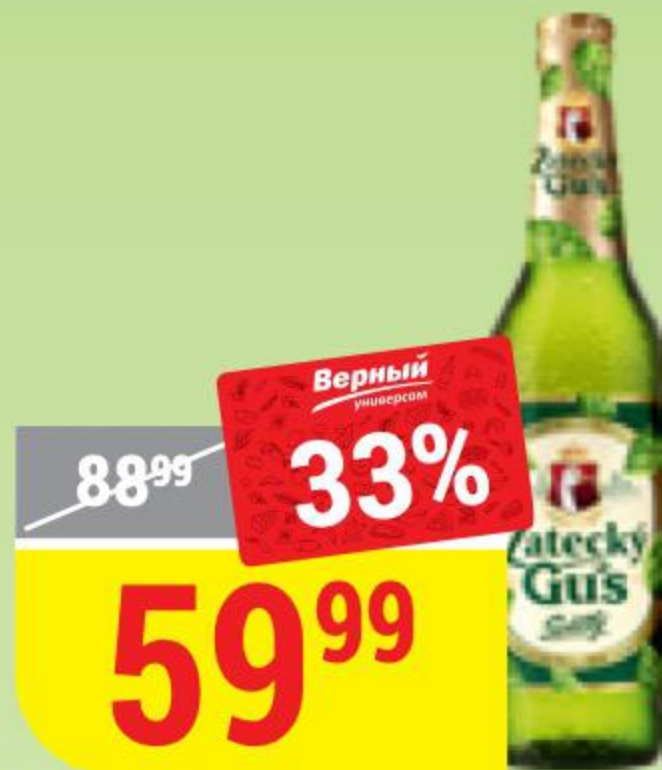
ПИВО ZATECKY GUS светлое, 4,6%, 0,48 л 123527