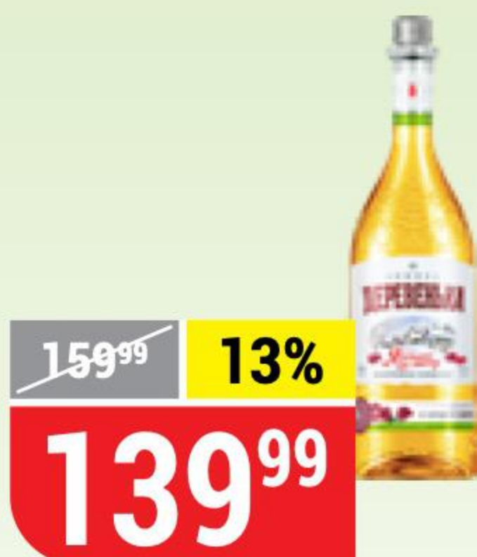
НАСТОЙКА ЗИМНЯЯ ДЕРЕВЕНЬКА яблоки на снегу, сладкая, 19%, 0,25 л 162467