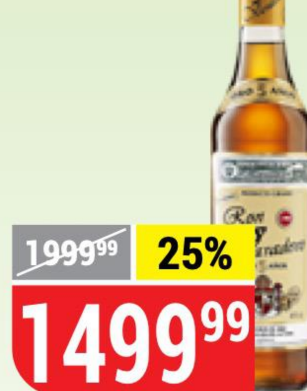
POM VARADERO anejo 5 anos, 38%, 0,7 л 163774