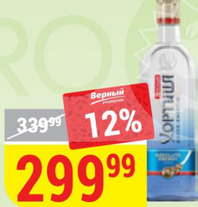
ВОДКА ХОРТИЦА absolute energy, 40%, 0,5 л 145159