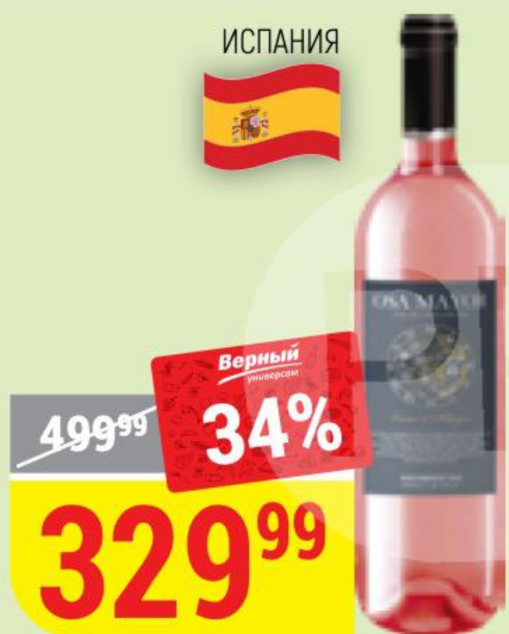
ВИНО OSA MAYOR rose, розовое, полусладкое, 11%, 0,75 л 161983