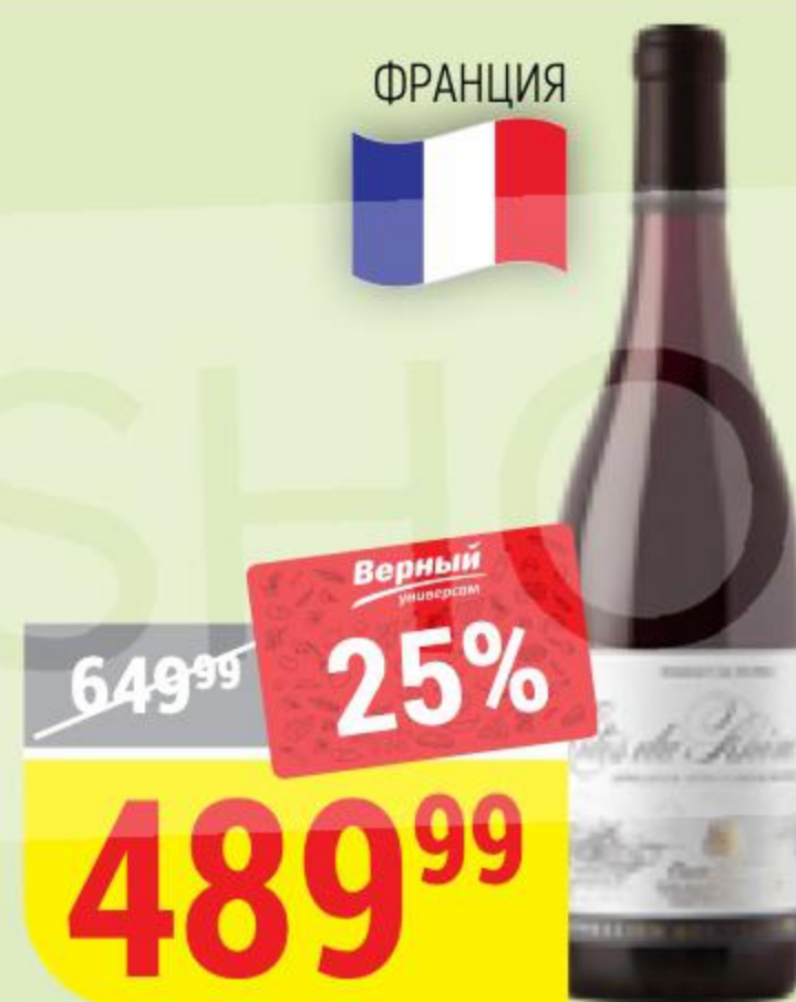
ВИНО COTES DU RHONE rouge, красное, сухое, 14%, 0,75 л 164575