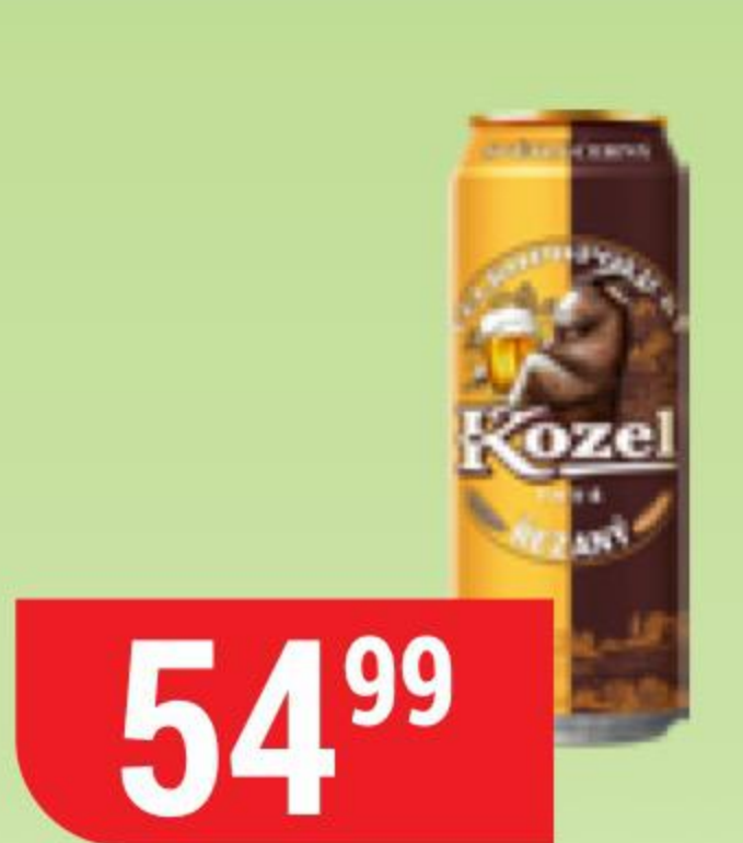
ПИВО VELKOROROVICKY KOZEL резаное, светлое, 4,7%, 0,45 л 137500