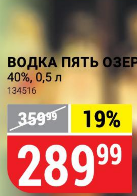
ВОДКА ПЯТЬ ОЗЕР 40%, 0,5 л 134516