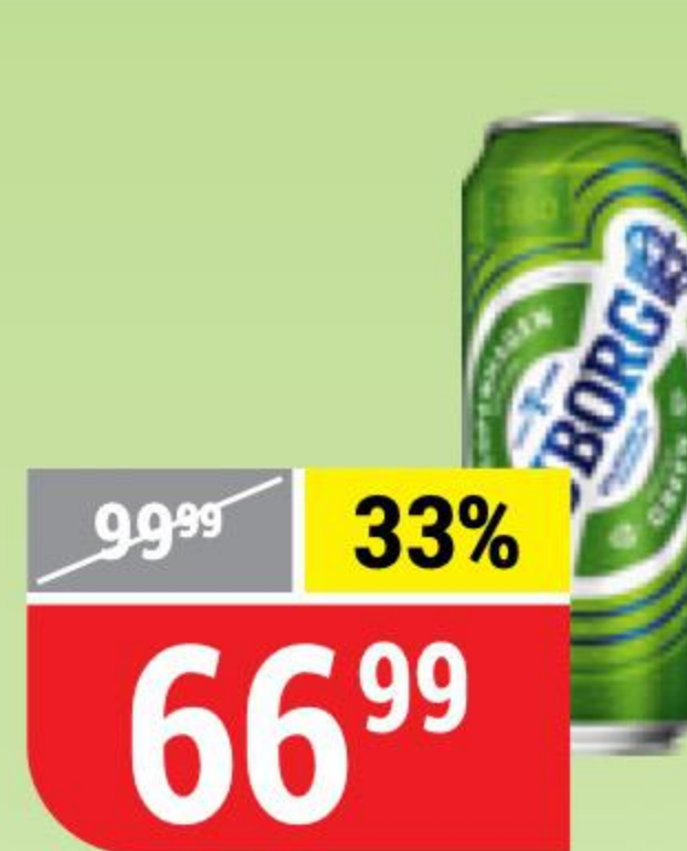
ПИВО TUBORG GREEN светлое, 4,6%, 0,45 л 123826