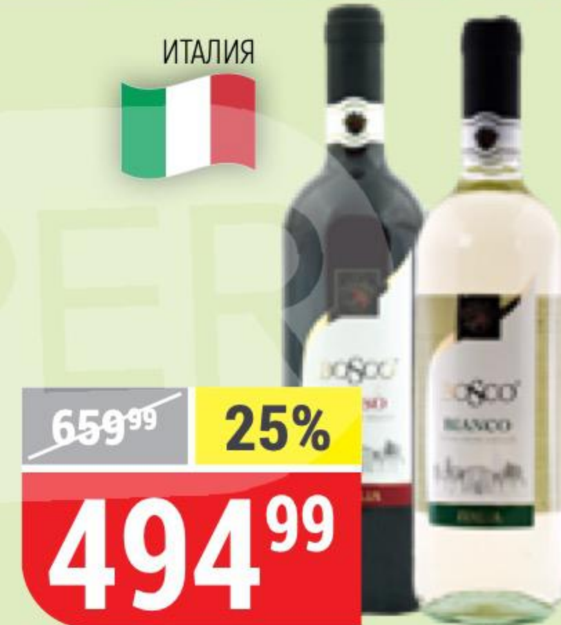
ВИНО BOSCO белое; красное, полусладкое, 9-12%, 0,75 л 119406/119407