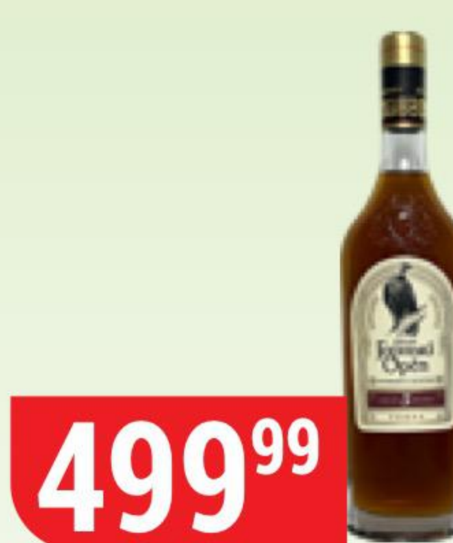
КОНЬЯК ГОРНЫЙ ОРЕЛ 5 лет, 40%, 0,5 л 161204