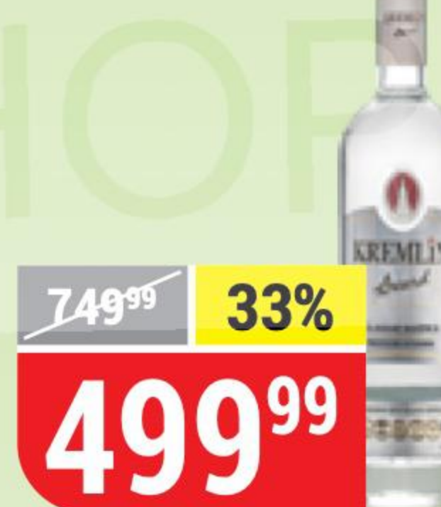
ВОДКА KREMLIN AWARD classic, 40%, 0,5 л 162469