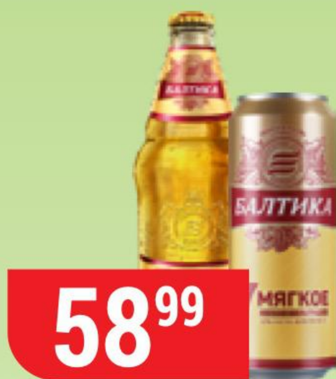
ПИВО БАЛТИКА №7 мягкое, светлое, 4,7%, 0,44-0,45 л 144307/144305