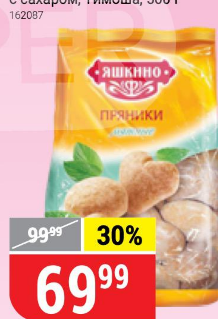
ПРЯНИКИ МЯТНЫЕ Яшкино, 350 г 100627