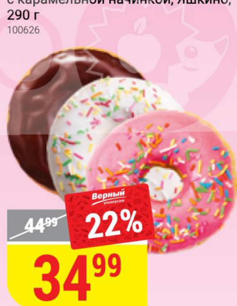
ДОНАТ в ассортименте, 53-58 г 126270/134111/134113