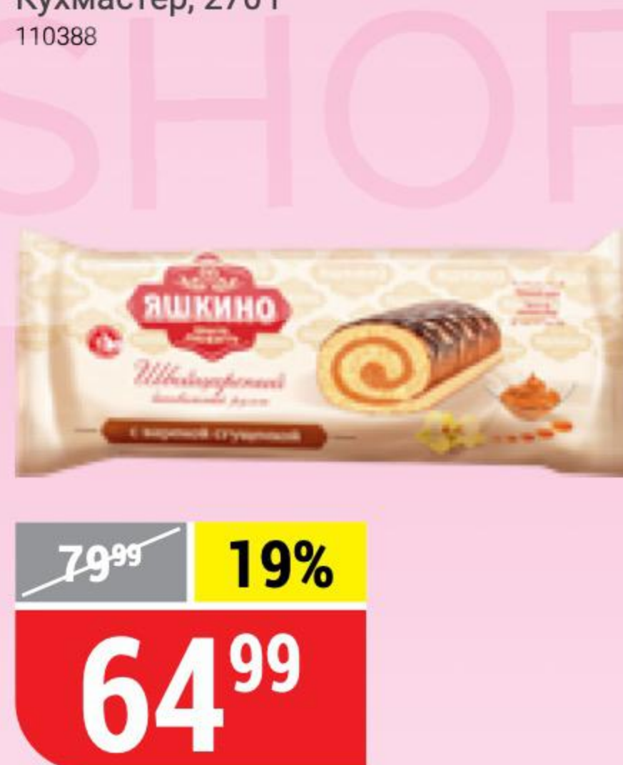
РУЛЕТ БИСКВИТНЫЙ ШВЕЙЦАРСКИЙ с вареной сгущенкой, Яшкино, 200 г 115416