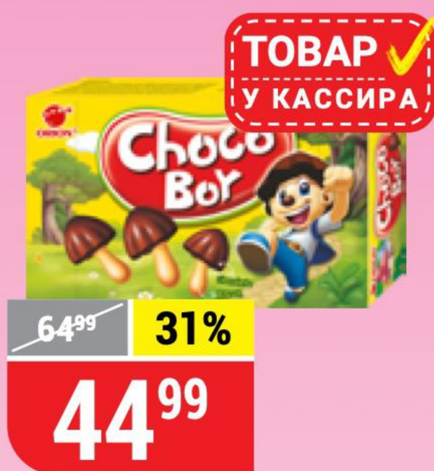
ПЕЧЕНЬЕ СНОСО БОУ Orion, 45 г 100597