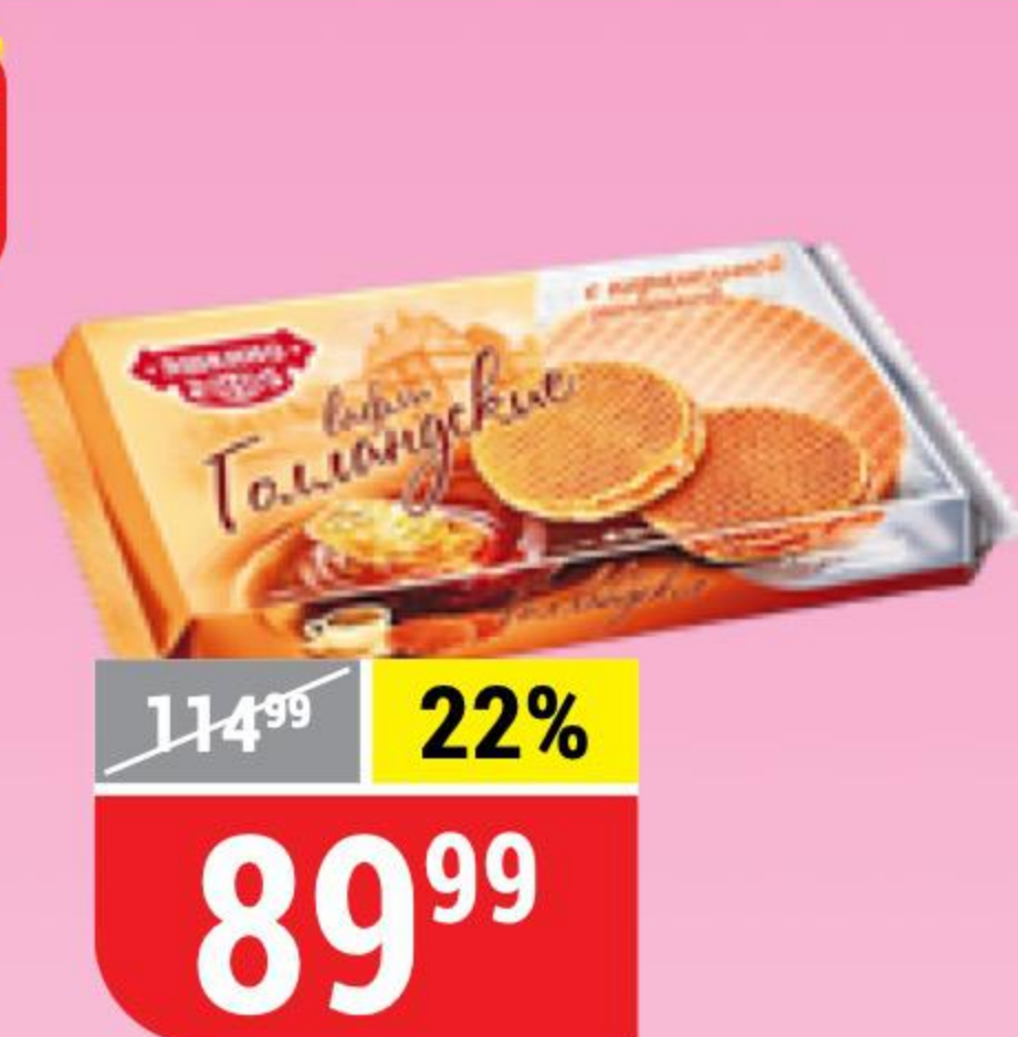
ВАФЛИ ГОЛЛАНДСКИЕ с карамельной начинкой, Яшкино, 290 г 100626