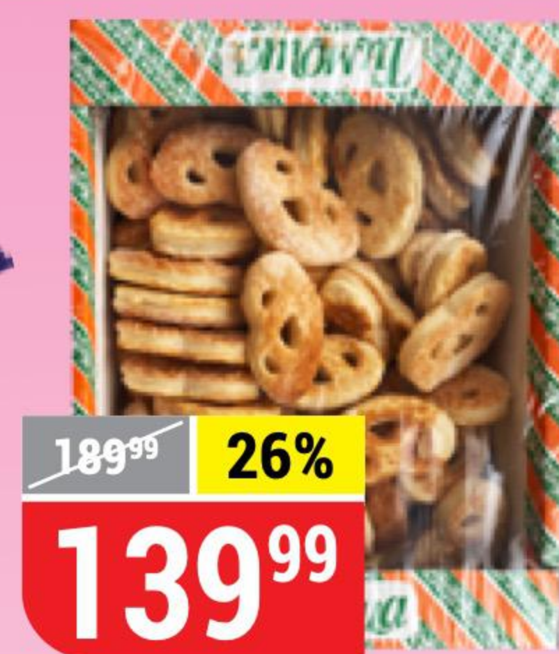
ПЛЮШКИ ФРАНЦУЗСКИЕ с сахаром, Тимоша, 500 г 162087