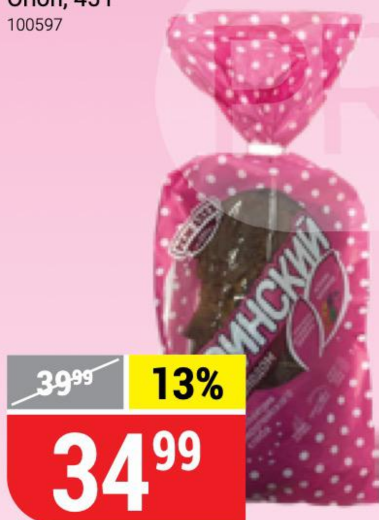
ХЛЕБ ФИНСКИЙ с солодом, нарезка, Режевской ХК, 350 г 141769