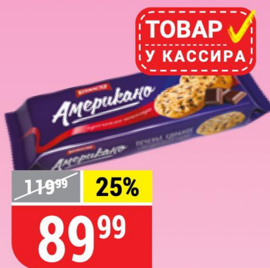
ПЕЧЕНЬЕ АМЕРИКАНО Кухмастер, 270 г 110388