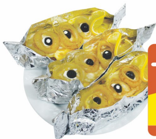
СКУМБРИЯ запеченная с яйцом 100гр