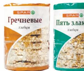
ХЛЕБЦЫ «СПАР» Вассортименте 100/110гр