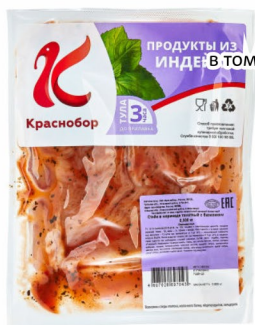
СТЕЙК в томатном маринаде с базиликом 500гр