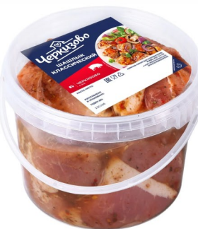
ШАШЛИК «Классический» с луком 1кг, Черкизово