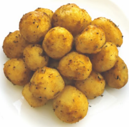
КАРТОФЕЛЬ «Аннушка» 100гр