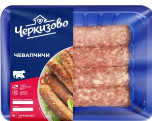
КОЛБАСКИ «Чевапчичи» 300гр, Черкизово