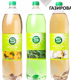
ГАЗИРОВАННЫЙ НАПИТОК «Смарт» в ассортименте 1.5л