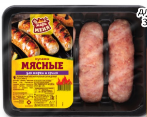
КУПАТЫ для жарки и гриля 320гр, Останкино