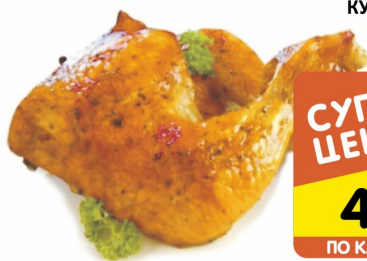
ОКОРОЧОК КУРИНЫЙ гриль 100гр