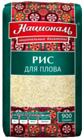
РИС «Националь» для плова 900гр