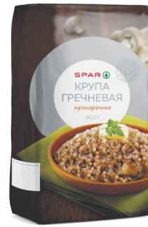
КРУПА ГРЕЧНЕВАЯ «СПАР» 900гр