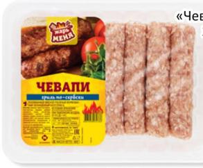
КОЛБАСКИ «Чевапи» По-сербски 320гр, Останкино