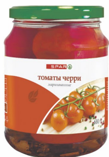
ТОМАТЫ ЧЕРРИ «СПАР» маринованные 680гр