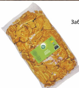
КРЕКЕР «Смарт» Забавные животные 400гр