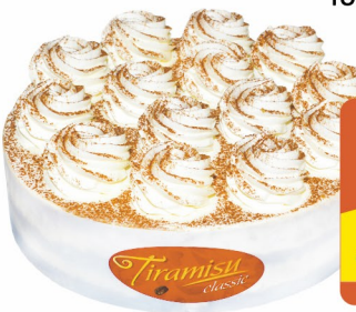
ТОРТ «Тирамису» Классический Фили-Бейкер 680гр