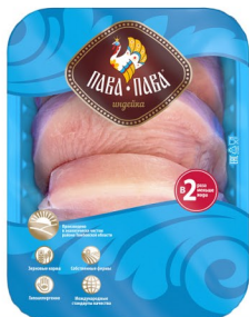
КОТЛЕТЫ «Пава-Пава» из мяса индейки 450гр