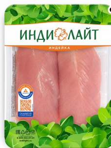
ФИЛЕ ИНДЕЙКИ МАЛОЕ «ИндиЛайт» 500гр