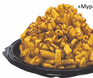
ТОРТ «Муравьиный домик» Фили-Бейкер 600гр