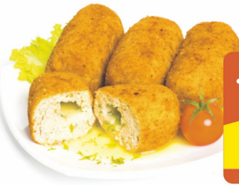
КОТЛЕТЫ «Киевские» классические 100гр