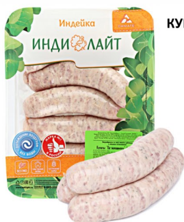
КУПАТЫ ИЗ ИНДЕЙКИ «ИндиЛайт» По-домашнему 500гр