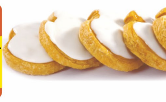
ИЗДЕЛИЯ СЛОЕННЫЕ «Берлинские» Фили-Бейкер 250гр