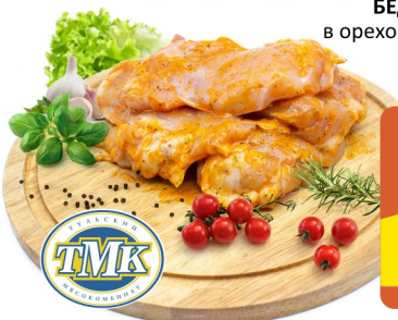
БЕДРО КУРИНОЕ в ореховом маринаде 1кг, ТМК