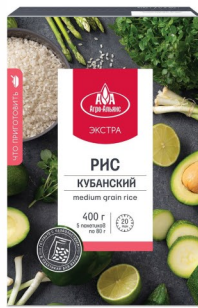
РИС КУБАНСКИЙ «Агро-Альянс» в пакетиках 5*80гр