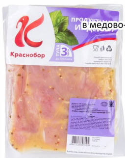
СТЕЙК в медово-горчичном маринаде 500гр