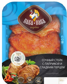
СТЕЙК ИЗ ИНДЕЙКИ «Пава-Пава» с паприкой и чили 500гр