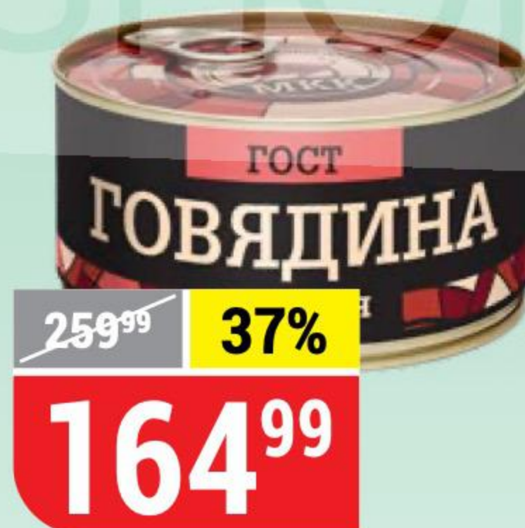
ГОВЯДИНА ТУШЕНАЯ МКК Балтийский, 325 г 156872