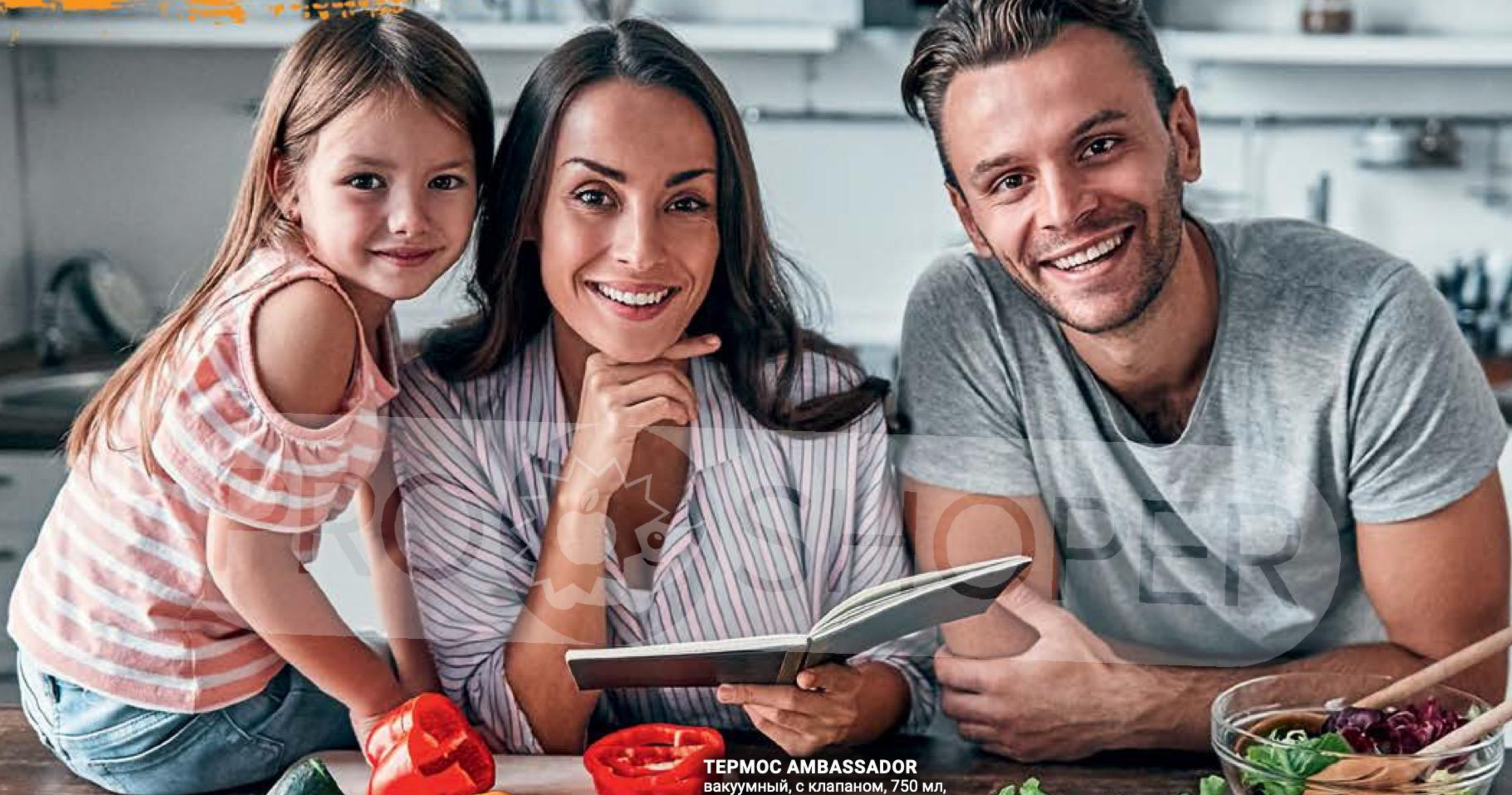
ТЕРМОС AMBASSADOR вакуумный, с клапаном, 750 мл, Gipfel, 1 шт. 158532