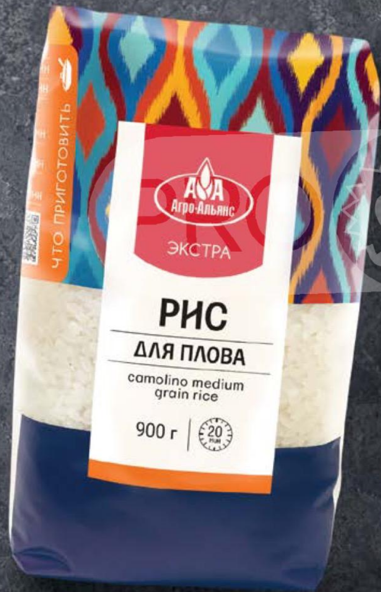
РИС ДЛЯ ПЛОВА экстра, Агро-Альянс, 900 г 152766