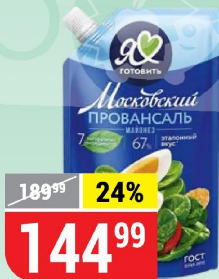
МАЙОНЕЗ ПРОВАНСАЛЬ классический, 67%, Я Люблю Готовить, 672 г 165094