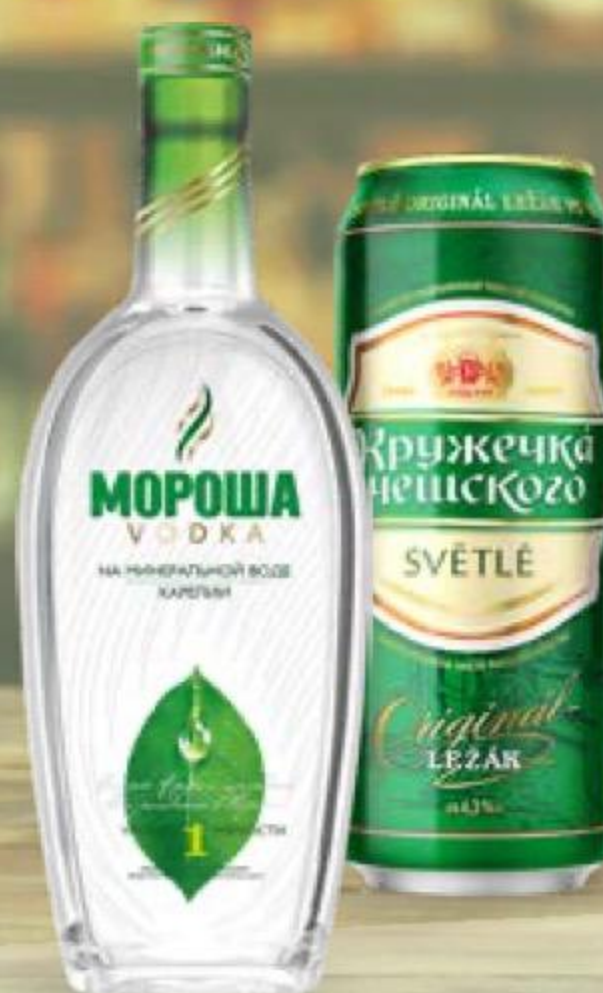
ВОДКА МОРОША на минеральной воде Карелии, 40%, 0,5 л 110340