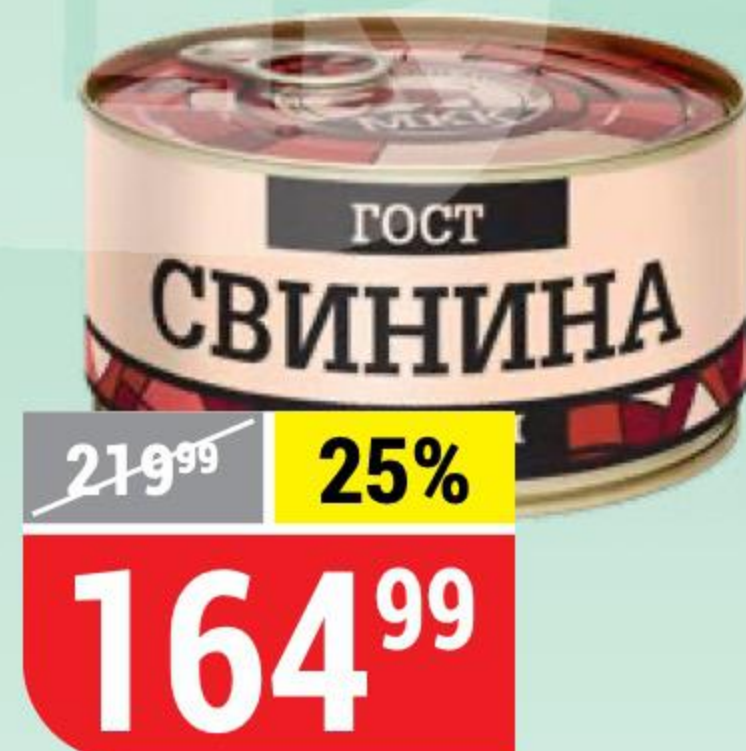
СВИНИНА ТУШЕНАЯ МКК Балтийский, 325 г 156874