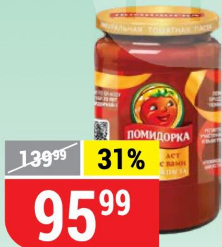
ТОМАТНАЯ ПАСТА ПОМИДОРКА 250 мл 107736