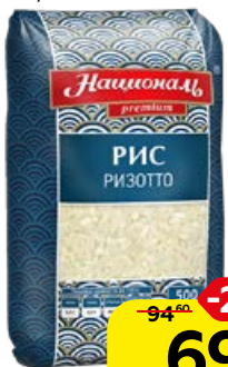
Рис ризотто НАЦИОНАЛЬ , Премиум, белый средне- зерный, 500 г