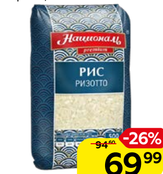
Рис ризотто НАЦИОНАЛЬ , Премиум, белый средне- зерный, 500 г