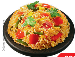
Рис ПО-МЕКСИКАНСКИ (СП), 100г