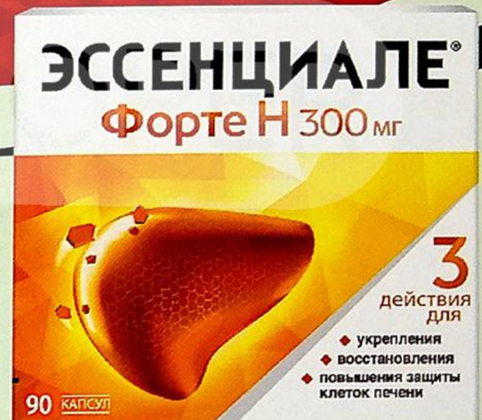
Эссенциале форте Н капс. 300мг №90