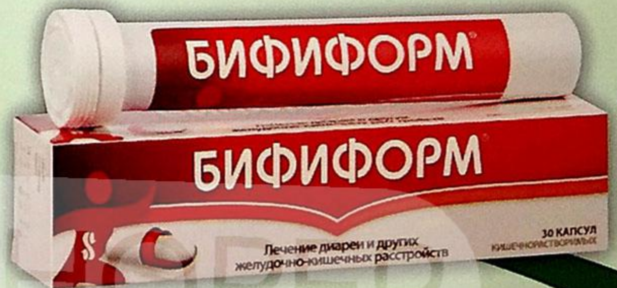
Бифиформ капс. №30