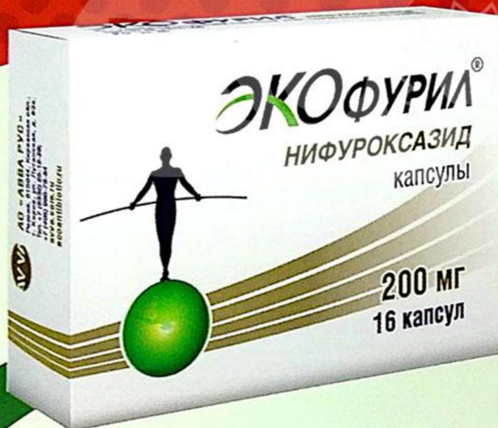
Экофурил капс. 200мг №16