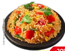
Рис ПО-МЕКСИКАНСКИ (СП), 100 г