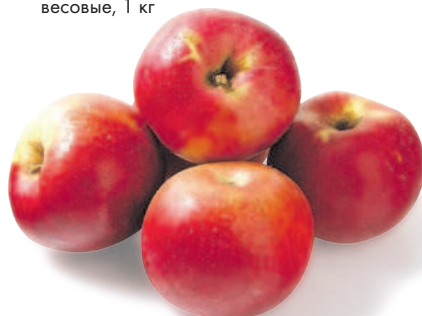
ЯБЛОКИ АЙДАРЕД, весовые, 1 кг