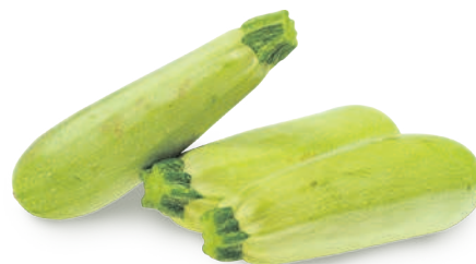
КАБАЧКИ, весовые, 1 кг