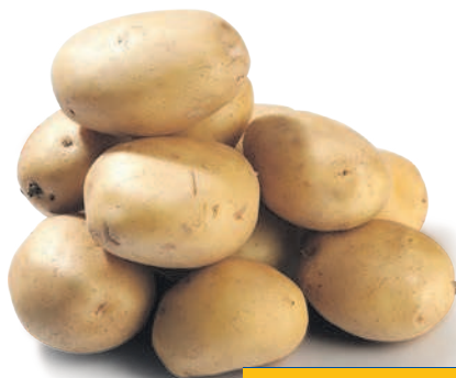
КАРТОФЕЛЬ МОЛОДОЙ БЕЛЫЙ, весовой, 1 кг