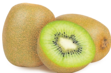
КИВИ, весовой, 1 кг