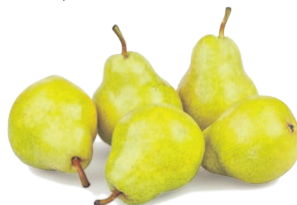
ГРУШИ ВИЛЬЯМС, весовые, 1 кг