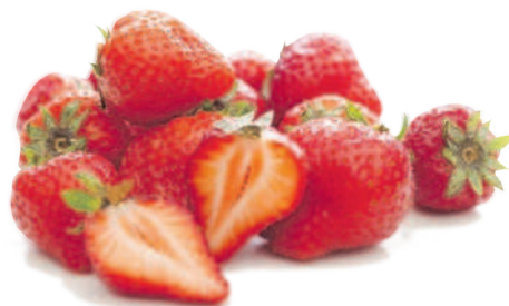
КЛУБНИКА, 250 г