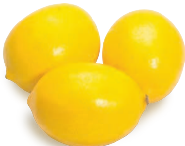
ЛИМОНЫ, весовые, 1 кг