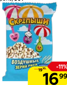
Рис воздушный СКРЕПЫШИ , в сахарном сиропе, 30г