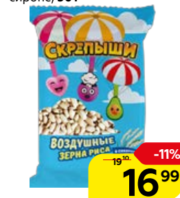
Рис воздушный СКРЕПЫШИ , в сахарном сиропе, 30 г