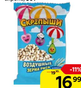
Рис воздушный СКРЕПЫШИ , в сахарном сиропе, 30 г