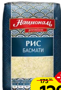
Рис НАЦИОНАЛЬ , Басмати, 500 г