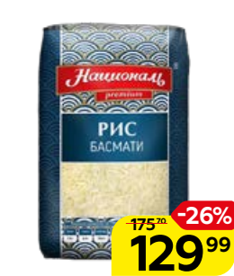
Рис НАЦИОНАЛЬ , Басмати, 500 г