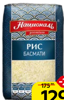
Рис НАЦИОНАЛЬ , Басмати, 500 г