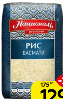
Рис НАЦИОНАЛЬ , Басмати, 500 г