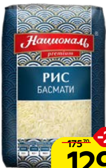
Рис НАЦИОНАЛЬ , Басмати, 500 г