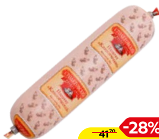
Паштет СТОЛЕТОВСКИЙ, Классический, 250 г