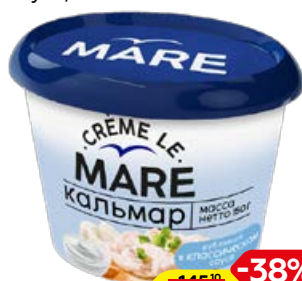
Кальмар CREME LE MARE рубленный, в классическом соусе, 150 г