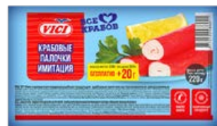
Палочки крабовые VICI, замороженные, 220 г