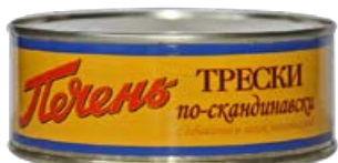
Печень трески МОРСКОЙ КОТИК, По-скандинавски, 240 г