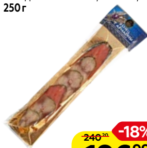
Ассорти рыбное ВЕНЕЦ АРИАДНЫ, горбуша-скуприя холодного копчения, косичка, 250 г