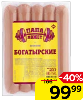
Сосиски ПАПА МОЖЕТ Богатырские, 400 г