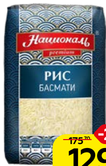
Рис НАЦИОНАЛЬ , Басмати, 500 г