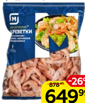
Креветки МАГНИТ Королевские, варено-мороженые, неразделанные, 1кг