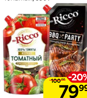
Кетчуп MR.RICCO, Для гриля и шашлыка/Томатный, 350 г