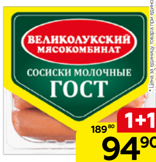
Сосиски МОЛОЧНЫЕ, ГОСТ (Великолуцкий МК), 330 г