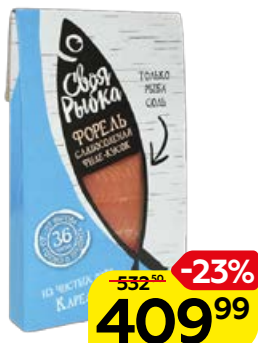
Форель СВОЯ РЫБКА, Слабосоленая, филе кусок, 200 г