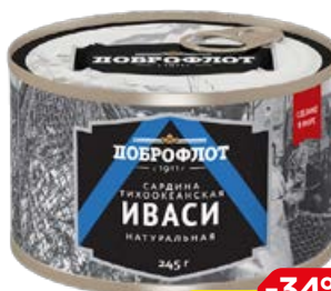
Сардина ИВАСИ, Тихоокеанская (Доброфлот), 245 г