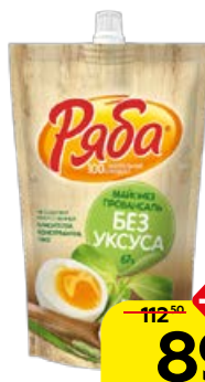
Майонез РЯБА без уксуса 67%, 330 г