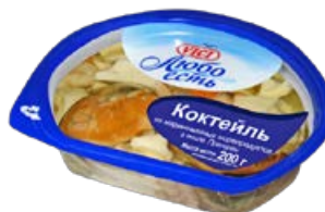
Коктейль из морепродуктов VICI, Любо есть, в масле, 200 г