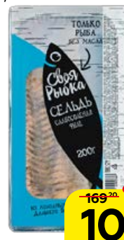
Сельдь СВОЯ РЫБКА тихоокеанская, слабосоленая, филе, 200 г