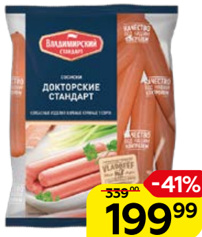
Сосиски ВЛАДИМИРСКИЙ СТАНДАРТ Докторские, 600 г