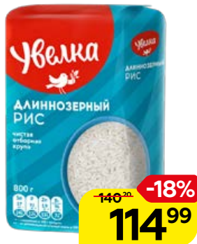
Рис УВЕЛКА , длиннозер- ный, 800 г