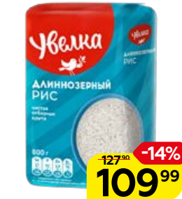
Рис УВЕЛКА , длиннозер- ный, 800 г