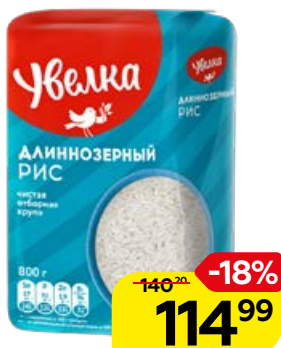
Рис УВЕЛКА , длиннозер- ный, 800 г