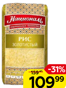
Рис НАЦИОНАЛЬ , золоти- стый, 900 г