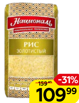
Рис НАЦИОНАЛЬ , золоти- стый, 900 г