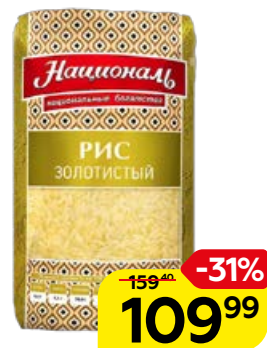
Рис НАЦИОНАЛЬ , золоти- стый, 900 г