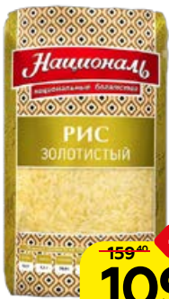
Рис НАЦИОНАЛЬ , золоти- стый, 900 г