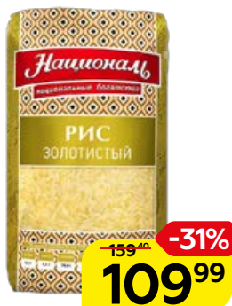
Рис НАЦИОНАЛЬ , золоти- стый, 900 г