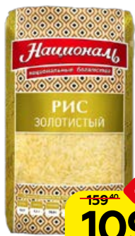
Рис НАЦИОНАЛЬ , золоти- стый, 900 г