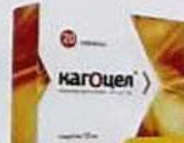
ТАБЛ. П. О. №30 ЛП-№(000120)-(РГ-РУ)