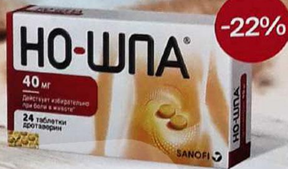
ТАБЛ. П. П. О. 40 МГ, №24 ЛП-005601