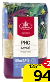
Рис ЭКСТРА , Бурый, Слим и Фит (Агро-Альянс), 800 г