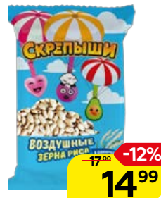
Рис воздушный СКРЕПЫШИ , в сахарном сиропе, 30 г