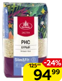
Рис ЭКСТРА , Бурый, Слим и Фит (Агро-Альянс), 800 г