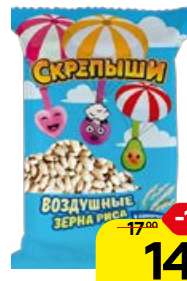
Рис воздушный СКРЕПЫШИ , в сахарном сиропе, 30 г