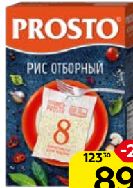
Рис PROSTO , Отборный, 8 пакетиков x 62,5 г