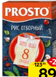
Рис PROSTO , Отборный, 8 пакетиков x 62,5 г