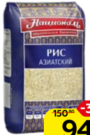
Рис НАЦИОНАЛЬ , Азиатский, 900 г