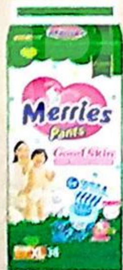
ТРУСИКИ MERRIES XL, 12-19 кг, 38 шт.