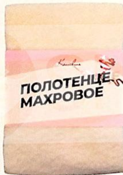
ПОЛОТЕНЦЕ МАХРОВОЕ 60X120 CM