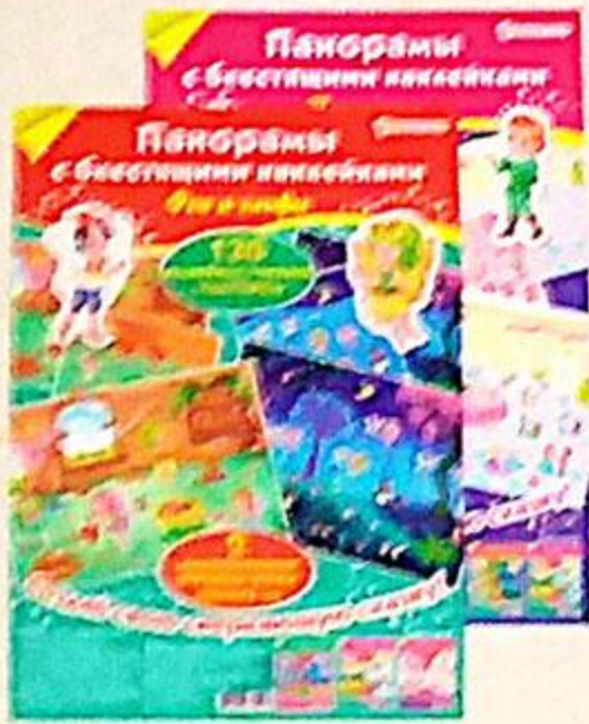
ПАНОРАМА С НАКЛЕЙКАМИ В АССОРТИМЕНТЕ