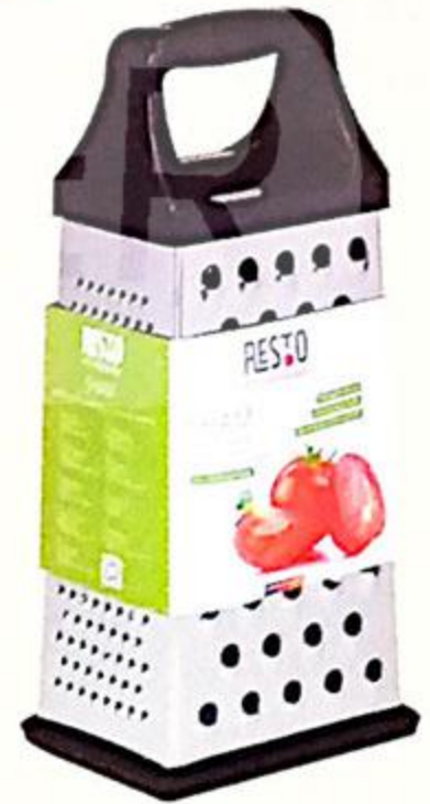
ТЁРКА 4-Х ГРАННАЯ 255X85X110 MM