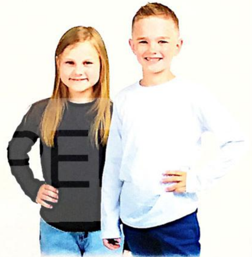
ЛОНГСЛИВ ДЕТСКИЙ ДЛЯ ДЕВОЧЕК; ДЛЯ МАЛЬЧИКОВ, 104-116 CM