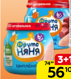
Пюре мясное** ФРУТОНЯНЯ , Цыпленок/Цыпленок-говядина, 80 г