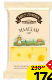
Сыр БРЕСТ-ЛИТОВСК , Маасдам, 200 г