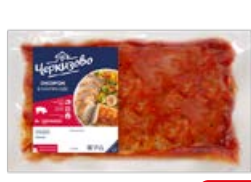
Окорок свиной ЧЕРКИЗОВО в маринаде, для запекания, охлажденный, 1 кг