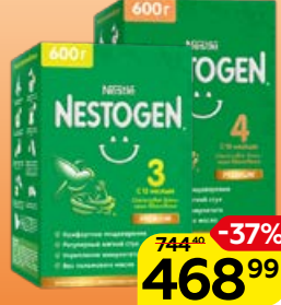
Молочко детское** NESTOGEN сухое: 3/4, 600 г