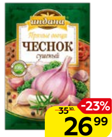
Чеснок сушеный ИНДАНА , 15 г