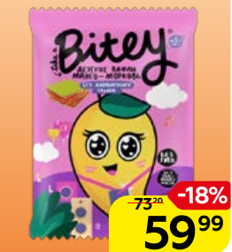
Вафли TAKE A BITEY манго-морковь, 35 г