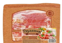
Грудинка МЯСНАЯ ИСТОРИЯ Южная, копчено-вареная, нарезка, 300 г