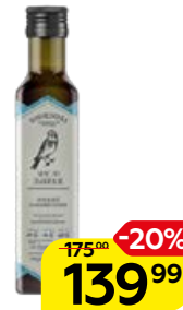
Масло льняное КОНОПЛЯНКА нерафинированное, 250 мл