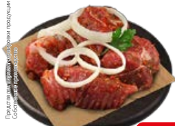
Полуфабрикат ШАШЛЫК, из свиной лопатки, Кавказский в маринаде, охлажденный (СП), 1 кг