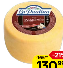
Сыр REGGIANITO , Ла Паулина, 100 г