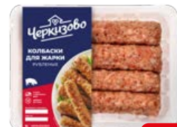
Колбаски свиные ЧЕРКИЗОВО рубленые, для жарки, 300 г