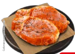
Полуфабрикат СТЕЙК ИЗ СВИНИНЫ в маринаде Алабама, охлажденный (СП), 1 кг