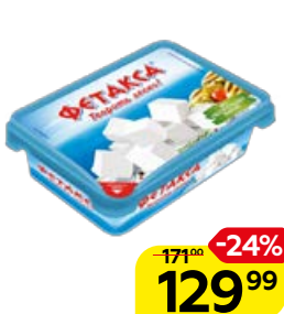
Сыр ФЕТАКСА , 200 г