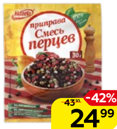
Приправа МАГЕТА , Смесь перцев, 30 г