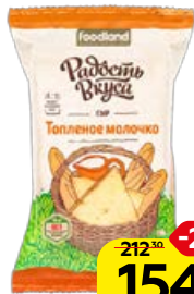
Сыр РАДОСТЬ ВКУСА Топлёное молочко, 200 г