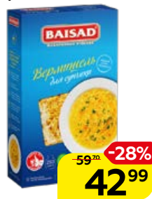
Макаронные изделия BAISAD вермишель для супа, 250 г