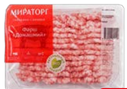
Фарш МИРАТОРГ, домашний, свинина-говядина, охлажденный, 400 г