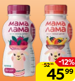
Йогурт МАМА ЛАМА Малина/Клубника-банан, 200 г