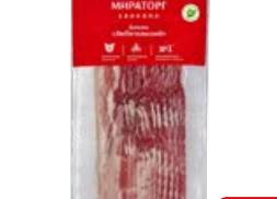
Бекон МИРАТОРГ, Любительский, охлажденный, 260 г