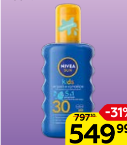
Спрей солнцезащитный NIVEA® , детский SPF 30, 200 мл