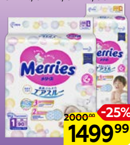
Подгузники MERRIES , В ассортименте***: 44 шт.; 54 шт.; 64 шт.; 82 шт.; 90 шт.