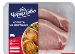
Коллета свиная ЧЕРКИЗОВО на косточке, охлажденная (ЧМПЗ), 500 г