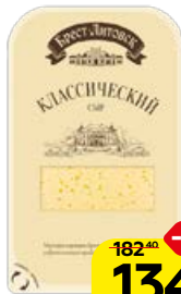
Сыр БРЕСТ-ЛИТОВСК , Классический, нарезка, 150 г