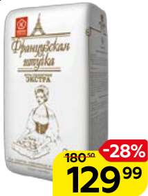
Мука пшеничная ФРАНЦУЗСКАЯ ШТУЧКА , Экстра, 2 кг