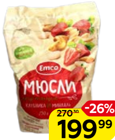
Мюсли хрустящие EMCO , с клубникой и миндалем, 750 г