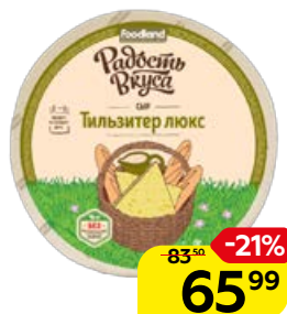
Сыр РАДОСТЬ ВКУСА , Тильзитер люкс, 100 г