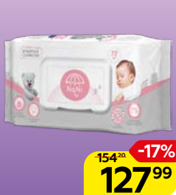
Влажные салфетки NANI® детские, 72 шт.