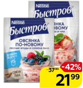
Овсянка БЫСТРОВ по-новому: клубника-чиа/ лесные ягоды-семена льна, 35 г