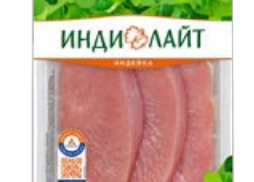
Стейк грудки индейки ИНДИЛАЙТ, охлажденный, 525 г