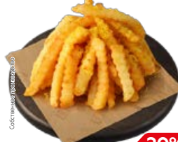
КАРТОФЕЛЬ ФРИ со специями (СП), 100 г