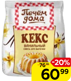
Смесь для кекса ПЕЧЕМ ДОМА ваниль, 300 г