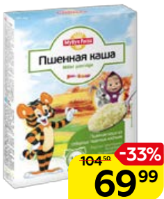
Каша пшеничная MYLLYN PARAS , 400 г