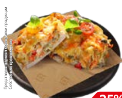
Свинина ЛЮБИТЕЛЬСКАЯ (СП), 100 г