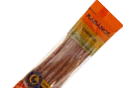
Колбаски KABANOS®, Чикен, сырокопченые (Ремит), 70 г