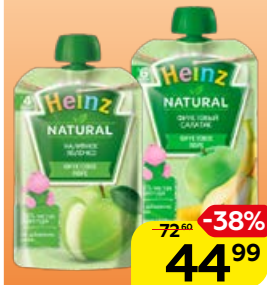
Пюре фруктовое** HEINZ , в ассортименте**, 90 г