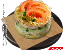
Салат РУССКАЯ КРАСАВИЦА (СП), 100 г