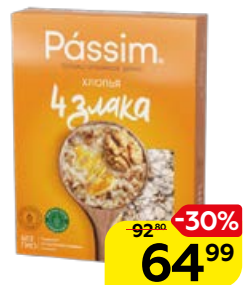
Хлопья PASSIM 4 злака, 450 г