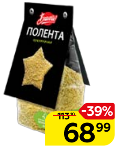
Полента BRAVOLLI , кукурузная, 300 г