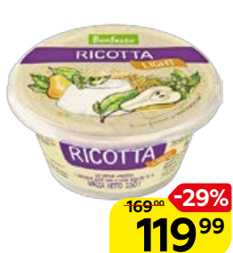
Сыр BONFESTO , рикотта лайт, 40%, 250 г