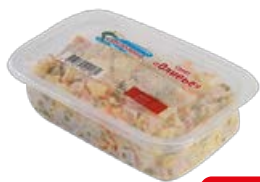
Салат ЕМЕЛЮШКА Оливье, 200 г