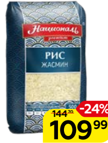
Рис НАЦИОНАЛЬ Жасмин, длиннозерный, 500 г