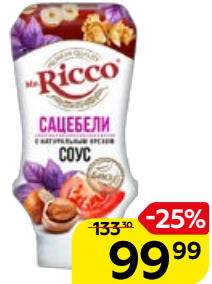
Соус MR.RICCO , Сацебели, 335 г