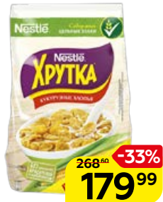
Завтрак готовый ХРУТКА , Хлопья кукурузные, 700 г