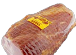
Шейка ПАПА МОЖЕТ Деликатесная (ОМПК), 100 г