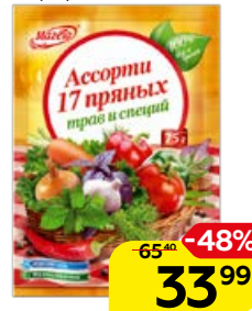
Приправа МАГЕТА , Ассорти, 17 пряных трав и специй, 75 г