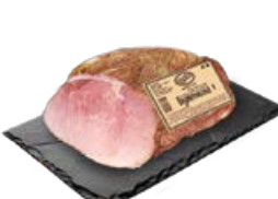
Буженина ДУБКИ Копчено-запеченная, 100 г