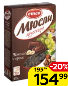
Мюсли EMCO , Хрустящие, шоколад и орехи, 375 г