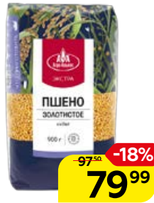
Пшено АГРОАЛЬЯНС , Экстра, 900 г