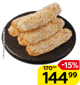
Пирожное ЭКЛЕР заварное, сливочный вкус (СП), 270 г