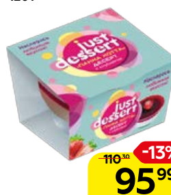
Десерт JUST DESSERT Панна Котта, клубника, 120 г