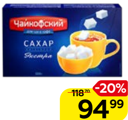
Сахар-рафинад ЧАЙКОФСКИЙ , 1 кг