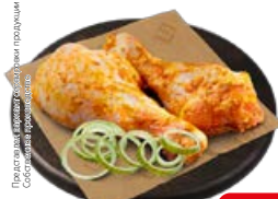
Полуфабрикат ГОЛЕНЬ КУРИНАЯ в маринаде Средиземноморский, охлажденная (СП), 1 кг