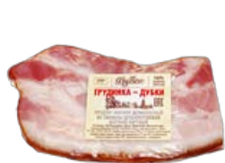
Грудинка ДУБКИ, варено-копченая, мини (МК Дубки), 100 г