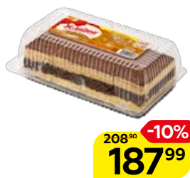
Пирожные УСЛАДОВ , Тирамису, 300 г