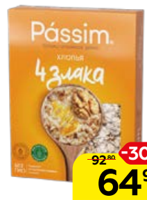
Хлопья PASSIM 4 злака, 450 г