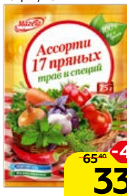
Приправа МАГЕТА , Ассорти, 17 пряных трав и специй, 75 г