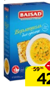
Макаронные изделия BAISAD вермишель для супа, 250 г