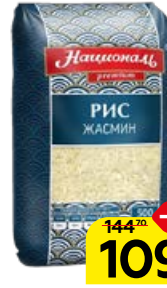
Рис НАЦИОНАЛЬ Жасмин, длиннозерный, 500 г