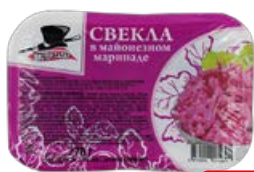
Свекла МИСТЕР САЛАТ, в майонезном маринаде, 270 г