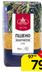
Пшено АГРОАЛЬЯНС , Экстра, 900 г