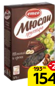
Мюсли EMCO , Хрустящие, шоколад и орехи, 375 г