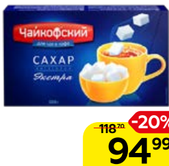
Сахар-рафинад ЧАЙКОФСКИЙ , 1 кг