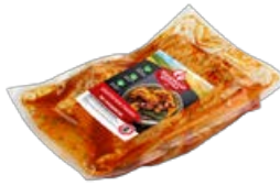
Цыпленок табака ПАВЛОВСКАЯ КУРОЧКА для гриля по-грузински охлажденный, 1 кг