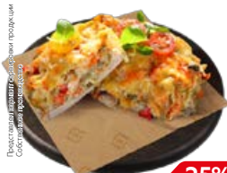
Свинина ЛЮБИТЕЛЬСКАЯ (СП), 100 г