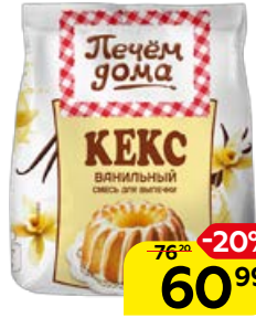
Смесь для кекса ПЕЧЕМ ДОМА ваниль, 300 г