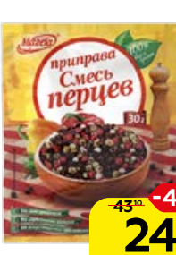
Приправа МАГЕТА , Смесь перцев, 30 г