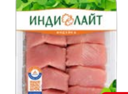
Медальон ИНДИЛАЙТ охлажденный, 500 г