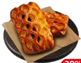
ПИРОГ с ягодами, 130 г