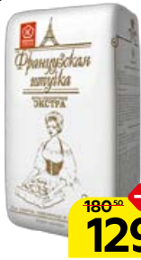
Мука пшеничная ФРАНЦУЗСКАЯ ШТУЧКА , Экстра, 2 кг