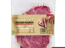
Стейк МИРАТОРГ Тендер, Блэк Ангус, мраморная говядина, 260 г