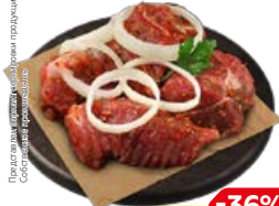
Полуфабрикат ШАШЛЫК, из свиной лопатки, Кавказский в маринаде, охлажденный (СП), 1 кг