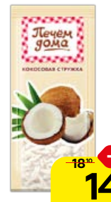
Кокосовая стружка ПЕЧЕМ ДОМА , 15 г