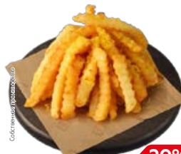
КАРТОФЕЛЬ ФРИ со специями (СП), 100 г