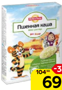
Каша пшеничная MYLLYN PARAS , 400 г