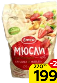
Мюсли хрустящие EMCO , с клубникой и миндалем, 750 г