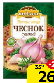
Чеснок сушеный ИНДАНА , 15 г