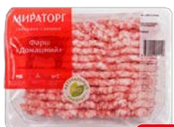
Фарш МИРАТОРГ, домашний, свинина-говядина, охлажденный, 400 г