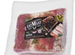
Шпик ЕАТМЕАТ® Классический, 300 г