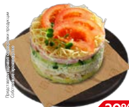
Салат РУССКАЯ КРАСАВИЦА (СП), 100 г