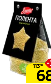
Полента BRAVOLLII , кукурузная, 300 г