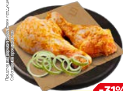
Полуфабрикат ГОЛЕНЬ КУРИНАЯ в маринаде Средиземноморский, охлажденная (СП), 1 кг