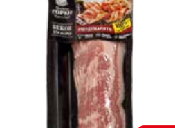
Бекон БЛИЖНИЕ ГОРКИ для жарки (Курский МПЗ), 260 г