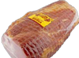
Шейка ПАПА МОЖЕТ Деликатесная (ОМПК), 100 г