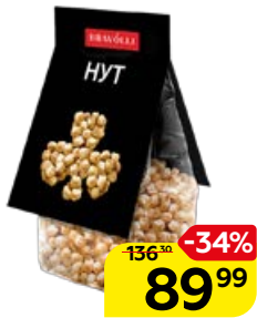
Нут BRAVOLLI , 350 г