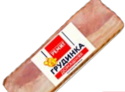
Грудинка ДОМАШНЯЯ, копчено-вареная, мини (Ремит), 100 г