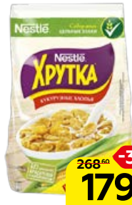
Завтрак готовый ХРУТКА , Хлопья кукурузные, 700 г