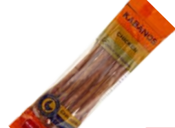
Колбаски КАВАНОС®, Чикен, сырокопченые (Ремит), 70 г