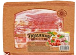
Грудинка МЯСНАЯ ИСТОРИЯ Южная, копчено-вареная, нарезка, 300 г