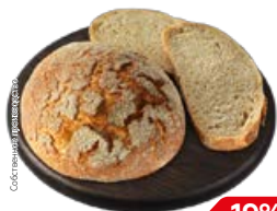
Хлеб ПРАЖСКИЙ (СП), 300 г