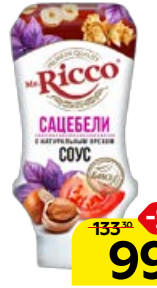
Соус MR.RICCO , Сацебели, 335 г