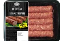
Чевапчичи БЛИЖНИЕ ГОРКИ, Свиные (Курский МПЗ), 300 г