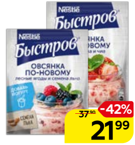
Овсянка БЫСТРОВ по-новому: клубника-чиа/ лесные ягоды-семена льна, 35 г