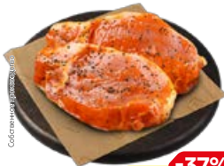
Полуфабрикат СТЕЙК ИЗ СВИНИНЫ в маринаде Алабама, охлажденный (СП), 1 кг