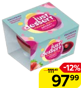
Десерт JUST DESSERT Панна Котта, клубника, 120 г