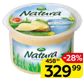
Сыр сливочный ARLA NATURA , Легкий, 400 г