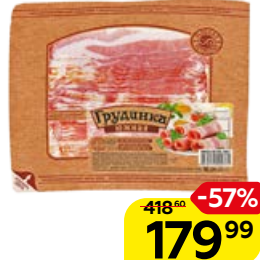
Грудинка МЯСНАЯ ИСТОРИЯ Южная, копчено-вареная, нарезка, 300 г