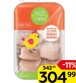
Филе бедра цыпленка-бройлера НАША ПТИЧКА охлажденная, 1 кг