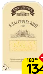
Сыр БРЕСТ-ЛИТОВСК , Классический, нарезка, 150 г