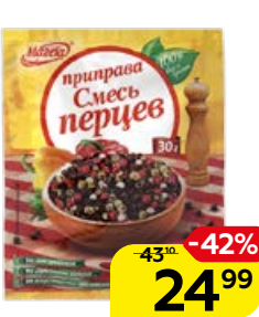
Приправа МАГЕТА , Смесь перцев, 30 г