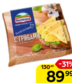
Сыр плавленый HOCHLAND , с грибами, 150 г