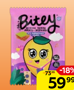
Вафли TAKE A BITEY манго-морковь, 35 г