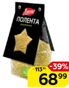
Полента BRAVOLLI , кукурузная, 300 г