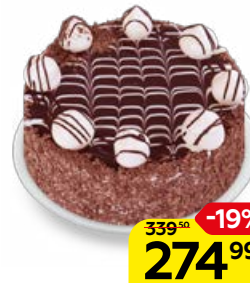
Торт МАНХЕТТЕН Смак, 360 г