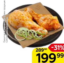
Полуфабрикат ГОЛЕНЬ КУРИНАЯ в маринаде Средиземноморский, охлажденная (СП), 1 кг