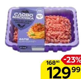
Фарш СЛОВО МЯСНИКА домашний, охлажденный, 400 г