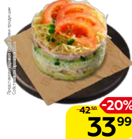
Салат РУССКАЯ КРАСАВИЦА (СП), 100 г