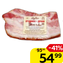
Грудинка ДУБКИ, варено-копченая, мини (МК Дубки), 100 г