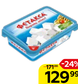
Сыр ФЕТАКСА , 200 г