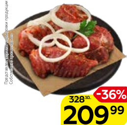
Полуфабрикат ШАШЛЫК, из свиной лопатки, Кавказский в маринаде, охлажденный (СП), 1 кг