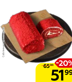
Рулет бисквитный БАРХАТНЫЙ ВЕЧЕР (СП), 100 г