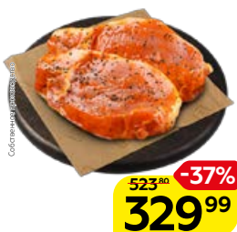
Полуфабрикат СТЕЙК ИЗ СВИНИНЫ в маринаде Алабама, охлажденный (СП), 1 кг