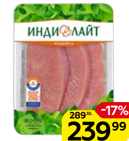
Стейк грудки индейки ИНДИЛАЙТ, охлажденный, 525 г