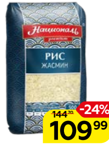
Рис НАЦИОНАЛЬ Жасмин, длиннозерный, 500 г