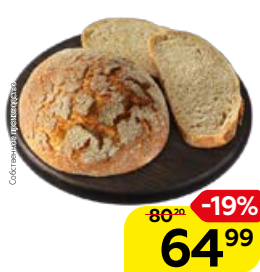
Хлеб ПРАЖСКИЙ (СП), 300 г