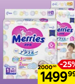
Подгузники MERRIES , В ассортименте***: 44 шт.; 54 шт.; 64 шт.; 82 шт.; 90 шт.