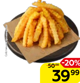
КАРТОФЕЛЬ ФРИ со специями (СП), 100 г