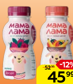
Йогурт МАМА ЛАМА Малина/ Клубника-банан, 200 г