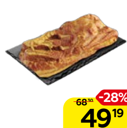
Грудинка ДОМАШНЯЯ, Копчено-вареная, мини (Челны-мясо), 100 г