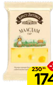
Сыр БРЕСТ-ЛИТОВСК , Маасдам, 200 г