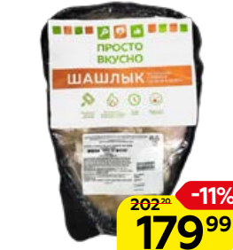
Шашлык куриный ПРОСТО ВКУСНО охлажденный, 1 кг