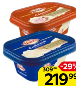
Сыр плавленый PRESIDENT , Сливочный/ С ветчины, 400 г