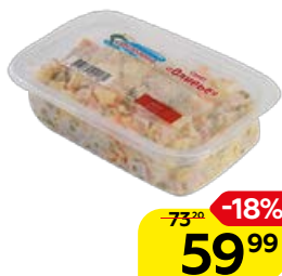
Салат ЕМЕЛЮШКА Оливье, 200 г