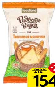
Сыр РАДОСТЬ ВКУСА Топлёное молочко, 200 г