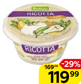
Сыр BONFESTO , рикотта лайт, 40%, 250 г