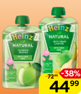
Пюре фруктовое** HEINZ , в ассортименте**, 90 г