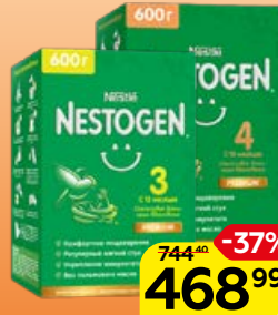
Молочко детское** NESTOGEN сухое: 3/4, 600 г