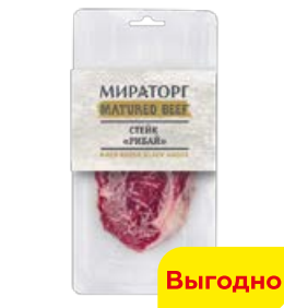
Стейк говяжий МИРАТОРГ Matured Beef Рибай, 250 г