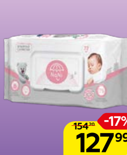
Влажные салфетки NANI ® детские, 72 шт.