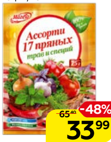
Приправа МАГЕТА , Ассорти, 17 пряных трав и специй, 75 г