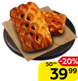
ПИРОГ с ягодами, 130 г