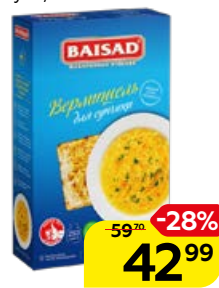
Макаронные изделия BAISAD вермишель для супа, 250 г