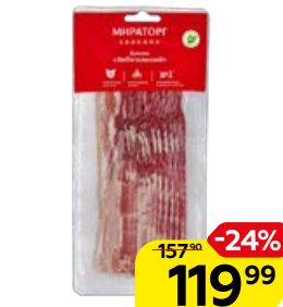
Бекон МИРАТОРГ, Любительский, охлажденный, 260 г