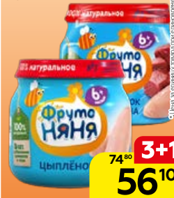
Пюре мясное** ФРУТОНЯНЯ , Цыпленок/ Цыпленок-говядина, 80 г