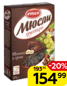
Мюсли EMCO , Хрустящие, шоколад и орехи, 375 г