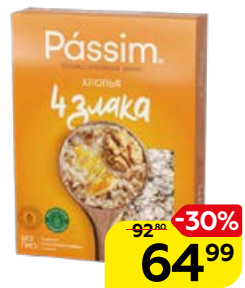
Хлопья PASSIM 4 злака, 450 г