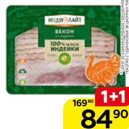
Бекон ИНДИЛАЙТ из индейки, вареный, нарезка, 120 г