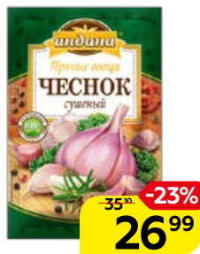
Чеснок сушеный ИНДАНА , 15 г