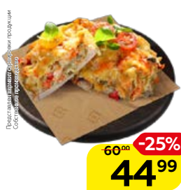
Свинина ЛЮБИТЕЛЬСКАЯ (СП), 100 г