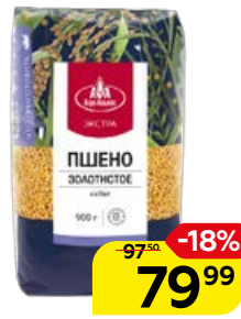
Пшено АГРОАЛЬЯНС , Экстра, 900 г