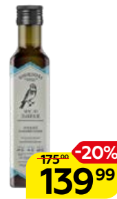
Масло льняное КОНОПЛЯНКА нерафинированное, 250 мл