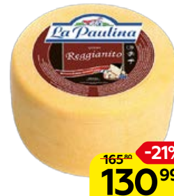
Сыр REGGIANITO , Ла Пау- лина, 100 г