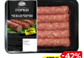
Чевапчици БЛИЖНИЕ ГОРКИ, Свиные (Курский МПЗ), 300 г