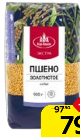
Пшено АГРОАЛЬЯНС , Экстра, 900 г