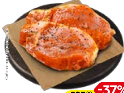
Полуфабрикат СТЕЙК ИЗ СВИНИНЫ в маринаде Алабама, охлажденный (СП), 1 кг