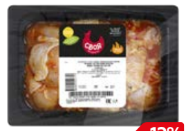
Шашлык куриный СВОЯ Классический, 1 кг