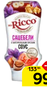
Соус MR.RICCO , Сацебели, 335 г