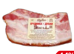
Грудинка ДУБКИ, варено-копченая, мини (МК Дубки), 100 г