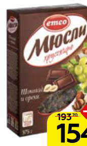
Мюсли EMCO , Хрустящие, шоколад и орехи, 375 г