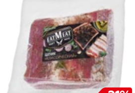
Шлик ЕАТМЕАТ® Классический, 300 г