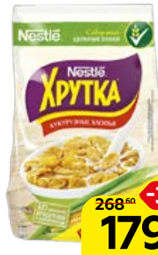
Завтрак готовый ХРУТКА , Хлопья кукурузные, 700 г