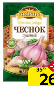
Чеснок сушеный ИНДАНА , 15 г