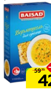
Макаронные изделия BAISAD вермишель для супа, 250 г