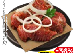
Полуфабрикат ШАШЛЫК, из свиной лопатки, Кавказский в маринаде, охлажденный (СП), 1 кг