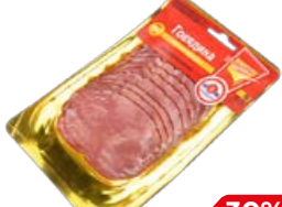
Говядина ЦАРИЦЫНО нарезка, копчено-вареная, 150 г