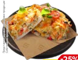
Свинина ЛЮБИТЕЛЬСКАЯ (СП), 100 г