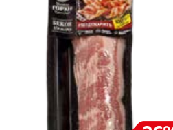
Бекон БЛИЖНИЕ ГОРКИ для жарки (Курский МПЗ), 260 г