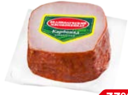
Карбонад СЛАВЯНСКИЙ, Варено-копченый (Великолукский МК), 300 г