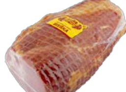
Шейка ПАПА МОЖЕТ Деликатесная (ОМПК), 100 г