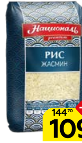
Рис НАЦИОНАЛЬ Жасмин, длиннозерный, 500 г