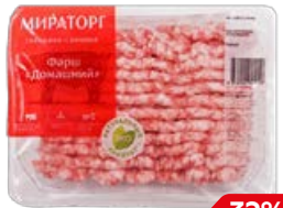
Фарш МИРАТОРГ, домашний, свинина-говядина, охлажденный, 400 г