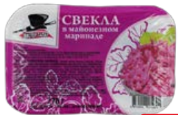
Свекла МИСТЕР САЛАТ, в майонезном маринаде, 270 г