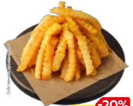
КАРТОФЕЛЬ ФРИ со специями (СП), 100 г