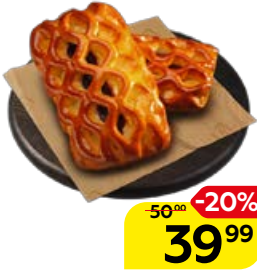
ПИРОГ с ягодами, 130 г