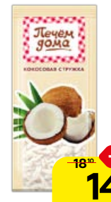
Кокосовая стружка ПЕЧЕМ ДОМА , 15 г