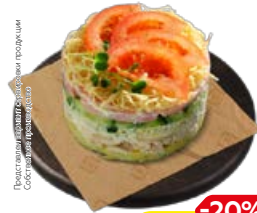
Салат РУССКАЯ КРАСАВИЦА (СП), 100 г