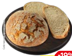
Хлеб ПРАЖСКИЙ (СП), 300 г