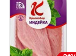
Стейк из индейки КРАСНОБОР охлажденный, 500 г