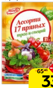
Приправа МАГЕТА , Ассорти, 17 пряных трав и специй, 75 г