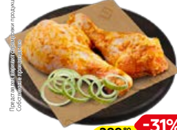
Полуфабрикат ГОЛЕНЬ КУРИНАЯ в маринаде Средиземноморский, охлажденная (СП), 1 кг