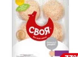
Шарики куриные СВОЯ, охлажденные (Воловский бройлер), 500 г