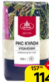
Рис КУЛОН , Кубанский (Агро-Альянс), 900 г