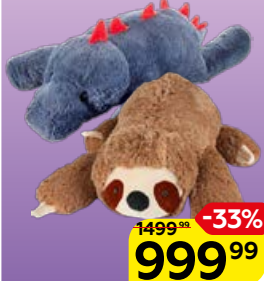
МЯГКАЯ ИГРУШКА Tallula в ассортименте***