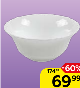
Салатник WAVE 12,6см, 1 шт.