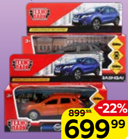
Машинка ТЕХНОПАРК Модели автомобилей, в ассортименте***, 1 шт.