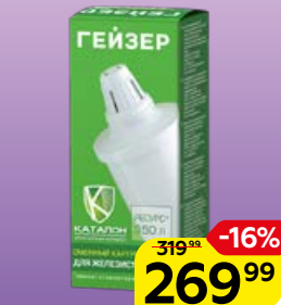
Катридж сменный ГЕЙЗЕР , №503, 1 шт.