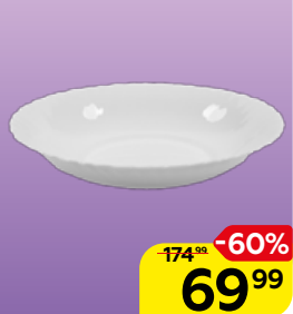
Тарелка WAVE суповая, 22см, 1 шт.