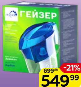
Фильтр-кувшин ГЕЙЗЕР Аквилон био, 3 л