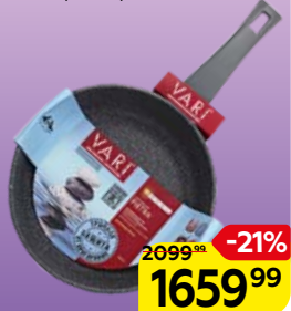
Сковорода АКВАФОР , мраморное покрытие, литая, 24см, 1 шт.