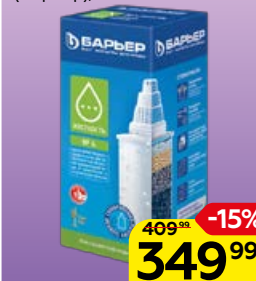
Кассета сменная БАРЬЕР 6, для фильтр-кувшина (Барьер), 1 шт.