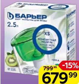
Фильтр-кувшин БАРЬЕР , Ника, 2,5 л