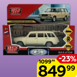
Машинка ТЕХНОПАРК Советское ретро, авто металл, в ассортименте***, 1 шт.