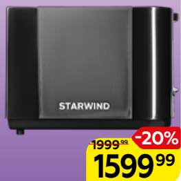
Тостер STARWIND ST2103/7002, 700 Вт, 1 шт.