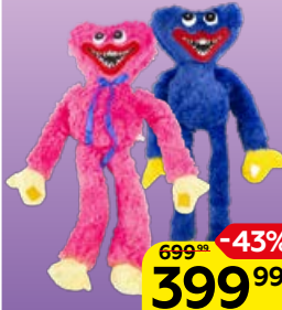
Мягкая игрушка NN фанта- стическое существо, 1 шт.