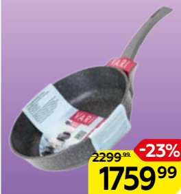
СКОВОРОДА Пиетра, мраморное покрытие, литая 4,6 мм, 26см, 1 шт.