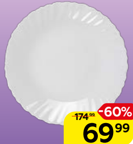
Тарелка WAVE десертная 19см, 1 шт.