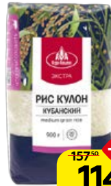
Рис КУЛОН , Кубанский (Агро-Альянс), 900 г